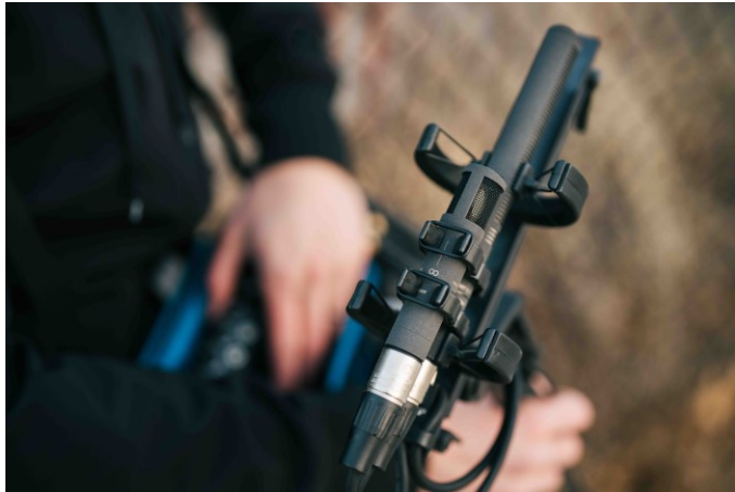
Los micrófonos de condensador Sennheiser MKH 8030 y MKH 8060 RF en una configuración estéreo MS