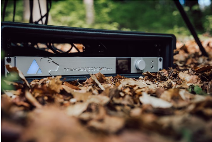
At IBC, Merging will show new hardware upgrades

una interfaz de audio inmersiva y un controlador de monitores. Merging presentará su conocido software DAW Pyramix y la interfaz Anubis, que incluye Misiones dedicadas (Commentary, Monitor, Music y Venue) que permiten personalizar el dispositivo para estos casos de uso típicos. Además, Merging también desvelará próximas actualizaciones con opciones de red adicionales.