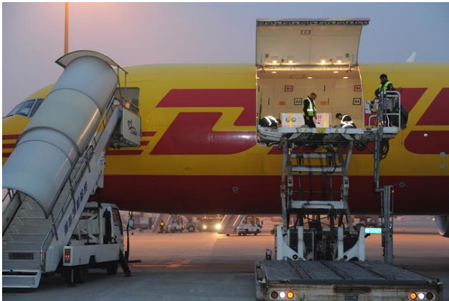
De goederen worden op 22 februari 2014 in een Boeing 767-vrachtvliegtuig van DHL geladen op Chengdu Shuangliu International Airport