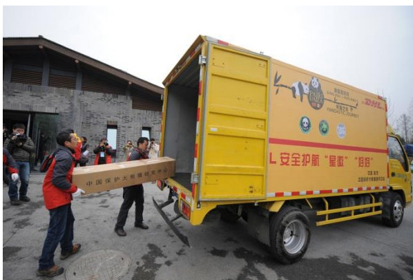
100 kg bederfbare goederen worden op 21 februari 2014 opgehaald in Chengdu, China