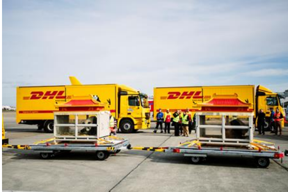
De vracht wordt op Brussels Airport voorbereid voor de laatste kilometer van de levering