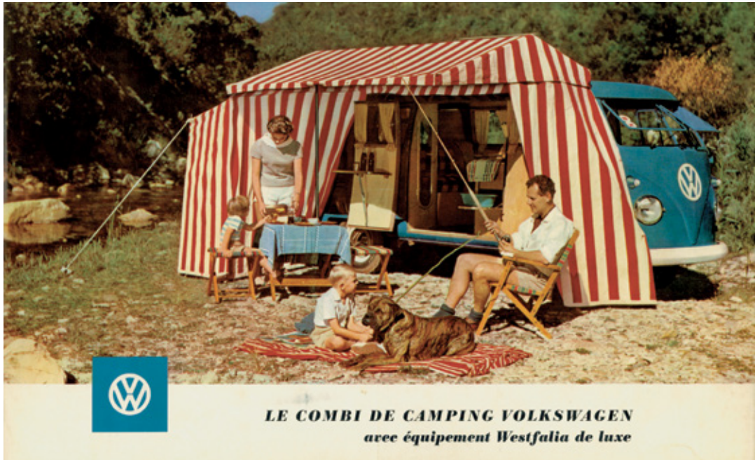
LE COMBI DE CAMPING VOLKSWAGEN avec équipement Westfalia de luxe