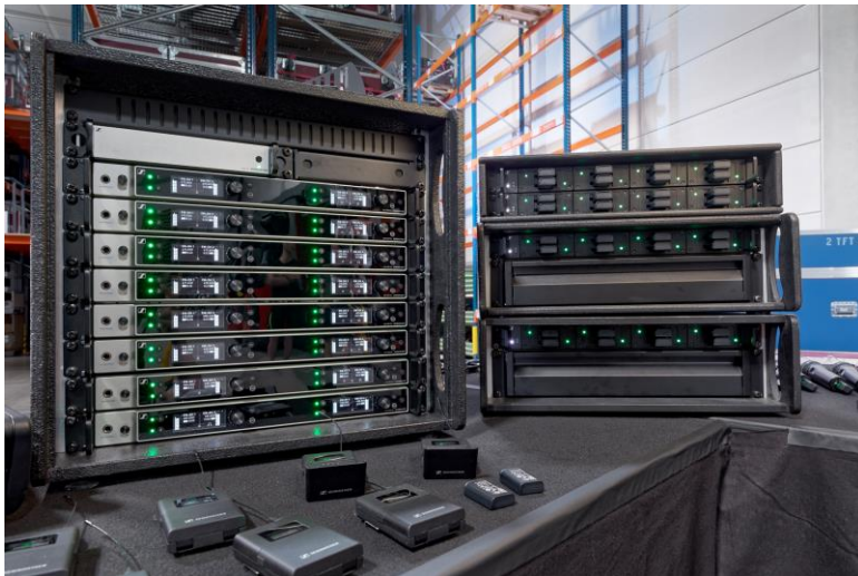
EW-DX bei Aventem

Mikrofonmodul in Echtkondensatortechnik). Die Systeme werden mit passiven Sennheiser ADP UHF Richtantennen (470 bis 1.075 MHz) betrieben und können über das Sennheiser Control Cockpit, den Sennheiser Wireless Systems Manager (WSM) oder – bei kleineren Systemen – die Sennheiser Smart Assist App aus der Ferne überwacht und gesteuert werden. Die vierkanaligen 19"-Receiver (1 HE) verfügen über integrierte Netzteile und werden bei Aventem digital über ihre Dante-Schnittstellen mit den ebenfalls digital arbeitenden Audiomischpulten verbunden.