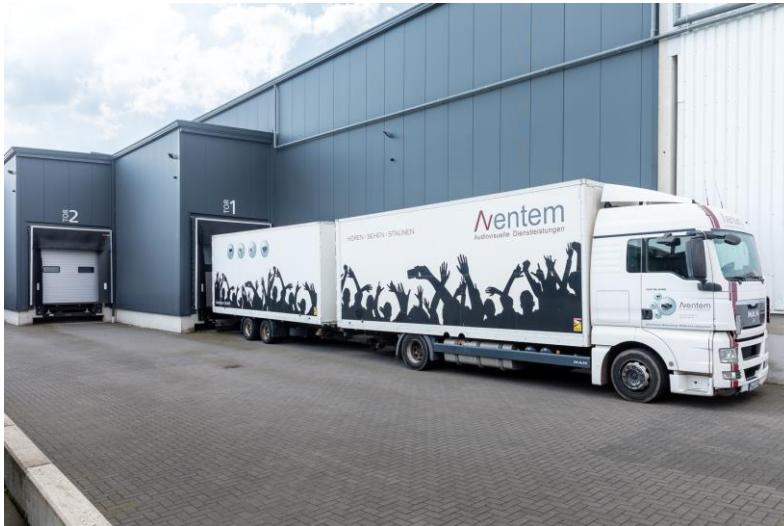
Trucks an der Lager- und Produktionsfläche

Gewerke sowie der Set- und Dekorationsbauten ein optimales Ergebnis zur vollständigen Zufriedenheit unserer Kundinnen und Kunden zu schaffen.“