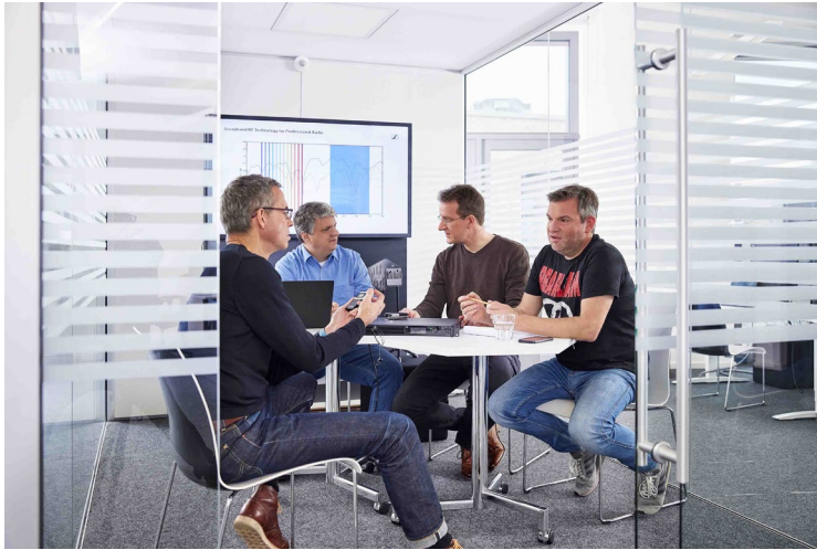
团队讨论最新 WMAS 工程样品

为什么您选择特定制造商的传输技术而不是标准技术？比如，使用 SIM 卡的 5G 麦克风。