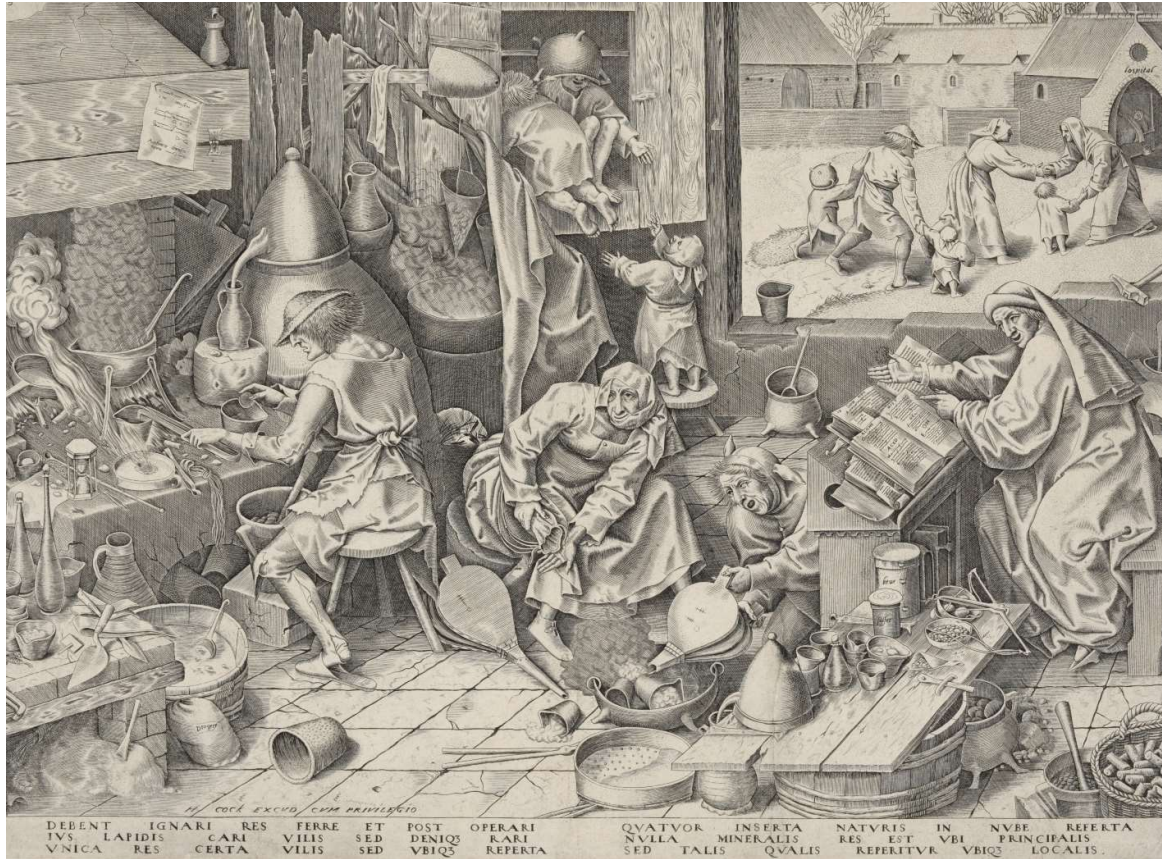
De alchemist, Philips Galle naar naar Pieter Bruegel de Oude

“ De alchemist vind ik zelf Bruegels meest geslaagde werk. Dwaasheid en hebzucht leiden tot de materiële ondergang van een alchemist en zijn gezin, die het ‘Al gemist’ heeft en zijn tijd en geld geïnvesteerd in ‘mistige’ pseudowetenschap. Diep ontroerend is de voorstelling van de spelende en naar eten zoekende kinderen. Net als het onthaal van de geruïneerde familie in het armenhuis dat we op de achtergrond zien. Let er op hoe Bruegel de figuren van de alchemist, zijn vrouw en ook de nar die met een blaasbalg nog meer stof en ‘mist’ spuit, karikaturaal heeft voorgesteld. Dit wekt ons misprijzen voor hun laakbare en bespottelijke gedrag op. De onschuldige kinderen die het slachtoffer zijn van het gedrag van hun ouders, heeft hij dan weer uiterst realistisch en schattig voorgesteld. Door de tegenstelling tussen humor en spot enerzijds en ontroering en erbarmen over het lot van het gezin anderzijds bereikt Bruegel bij de beschouwer een cathartisch effect. De alchemist is wellicht Bruegels meest narratieve en in zekere zin zelfs ‘theatrale’ prent.”