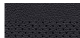
Zetelbekleding in leder - Antraciet