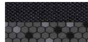
Zetelbekleding in stof - Antraciet