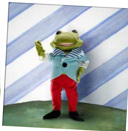
De wereld van TOSIG