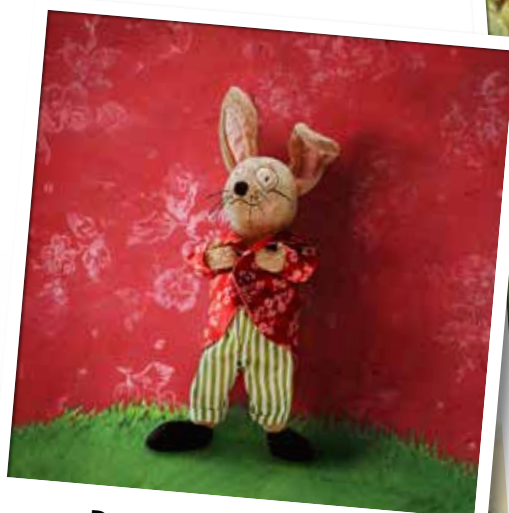
De wereld van PIPHARE

In oktober 2014 wordt in de IKEA woonwarenhuizen een splinternieuw assortiment knuffels gelanceerd. We kozen 5 helden als boegbeelden van de actie. Zelf zijn ze zacht, maar ze zullen keihard werken om van deze actie de beste ooit te maken.