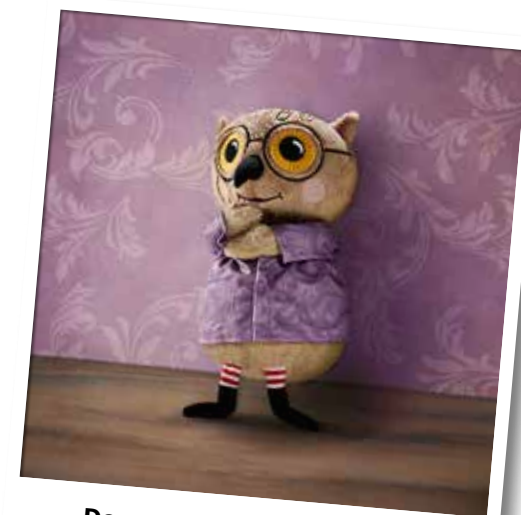
De wereld van KATTUGGLA