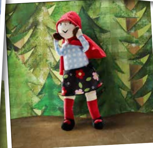
De wereld van LILLGAMMAL