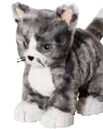
LILLEPLUTT knuffel, kat 5,99 Designer: IKEA of Sweden 002.604.51