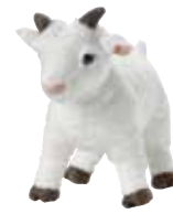
NIEUW LAPPGET knuffel, geit 4,99 Designer: IKEA of Sweden 102.802.17