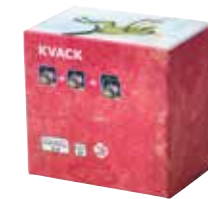
NIEUW KVACK kaartspel IKEA FAMILY prijs 3,99 Normale prijs 4,99 302.817.58