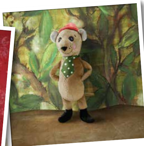
De wereld van HASSELMUS