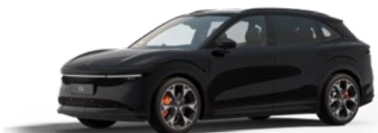
Onyx Black (Option)