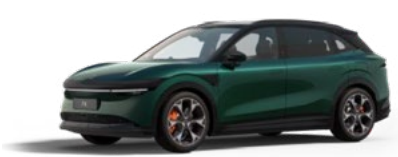
Forest Green (Option, pas sur Core)