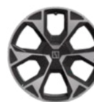
Jantes en alliage 21 pouces (Standard Privilege)

Toit noir contrasté (De série sur Privilege AWD uniquement)