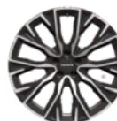
Jante en alliage 20 pouces (Option Long Range)