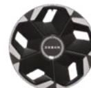
Jantes en alliage 19 pouces Aéro (Standard Long Range)