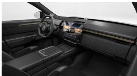
Sellerie tissu (Textile & PU) Intérieur noir Bermuda Slope (Standard Core & Long Range)

Toit noir contrasté (De série sur Privilege AWD uniquement)