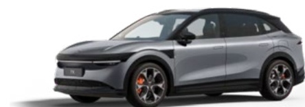
Tech Grey (Option)