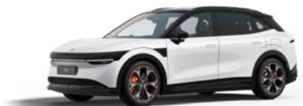
Christal White (Standard)