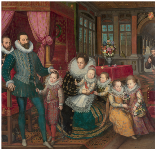
Familieportret van Karel van Arenberg en Anna van Croÿ

Benieuwd naar het leven op het kasteel? Bezoek dan ook de tentoonstelling in de Universiteitsbibliotheek, waar je meer te weten komt over het iconische kasteel van Arenberg in Heverlee, nabij Leuven. Je krijgt er een unieke inblik in het kasteel en het leven van zijn bewoners.