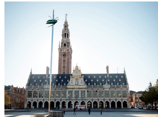
Universiteitsbibliotheek Leuven