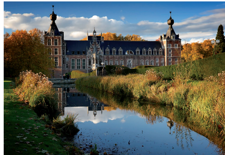
Het kasteel van Arenberg in Heverlee