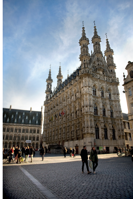
Stadhuis Leuven