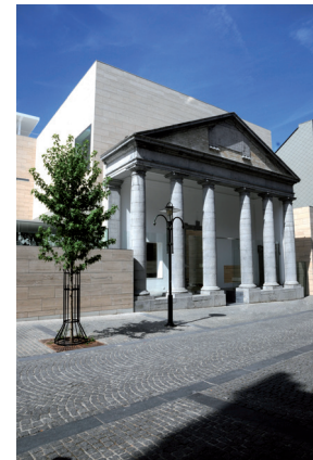
M-Museum Leuven © Karel Rondou