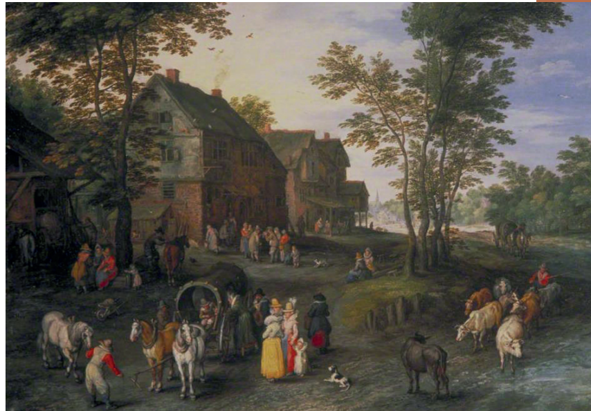
Jan Breughel de Oudere, Dorpsgezicht met een vertrekend gezelschap