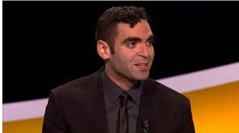
Filmregisseur Adil El Arbi

"Ik vind het belangrijk om extra focus te brengen op kinderen en jongeren in Brussel. Ik heb zelf familie in Brussel met kinderen die daar opgroeien, dus het ligt me nauw aan het hart. Beweging en sport is belangrijk voor alle mensen van alle leeftijden, maar niet altijd vanzelfsprekend. Het is een beschikbare remedie die het leed van kinderen met diabetes type 1 aanzienlijk kan verlichten en daarom moeten we er alles voor doen om sport te stimuleren. Ik probeer de kinderen van mijn familie in Brussel te motiveren en via deze weg hoop ik hetzelfde te doen voor andere kinderen."