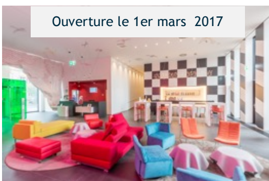
Ouverture le 1er mars 2017