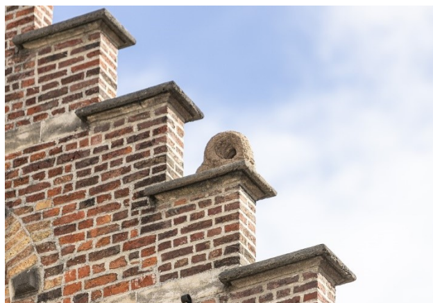
Adrián Villar Rojas - From the series Brick Farm, 2021, kurimanzutto, Mexico; Marian Goodman Gallery, New York