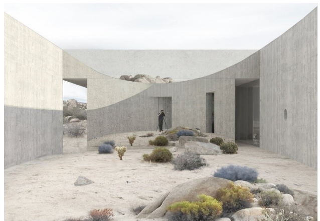
Jon Lott - Pioneertown House © PARA