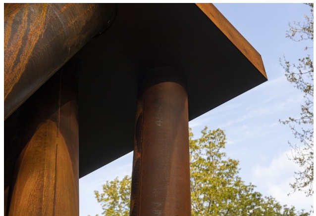
Gijs Van Vaerenbergh - Colonnade, Triennale Brugge 2021