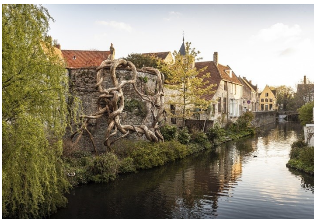
Henrique Oliveira - Banisteria Caapi (Desnatureza 4), 2021, VALLOIS, Paris; Van de Weghe, New York

http://www.henriqueoliveira.com/defaultUS.asp