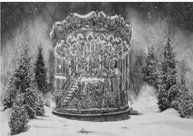
Danse Macabre © Hans Op de Beeck.

website Hans Op de Beeck: https://hansopdebeeck.com/