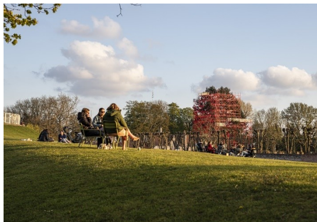
Héctor Zamora - Strangler, 2021, Labor, Mexico; Luciana Brito Galeria, Sao Paulo; Albarrán Bourdais, Madrid - TriënnaleBrugge 2021