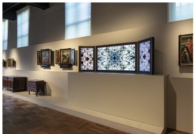
Laura Splan - Disentanglement, 2021