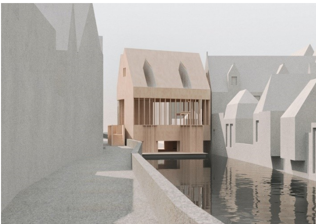
Jon Lott - The Bruges Diptych - 2021 © Jon Lott