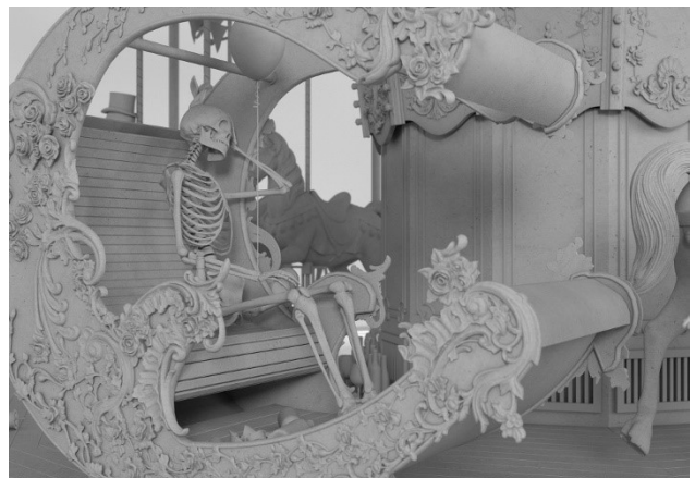
Hans Op de Beeck - Danse Macabre, carousel—work in progress © Studio Hans Op de Beeck