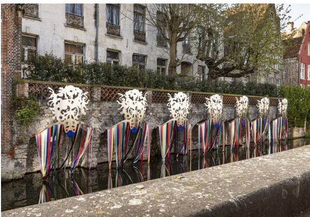
Nadia Naveau - Les Niches Parties, 2021, Base-Alpha Gallery, Antwerpen

De Augustijnenrei , uitgegraven in de 12de eeuw en overspannen door een brug met dezelfde naam, verwijst naar het Augustijnenklooster dat hier tot op het eind van de 18de eeuw stond.