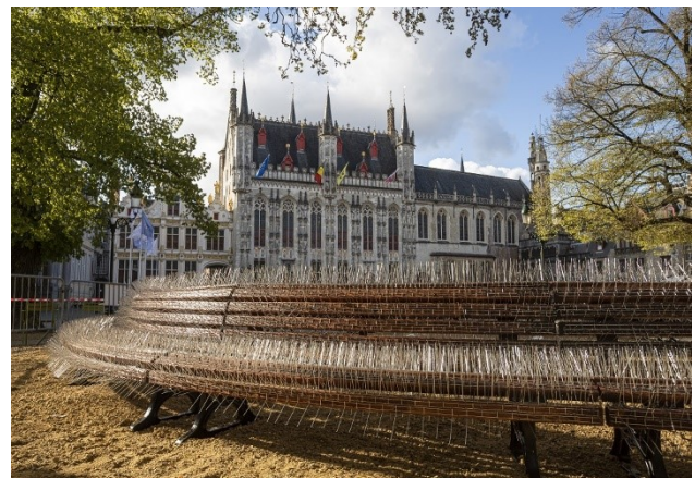
Nadia Kaabi-Linke - Inner Circle