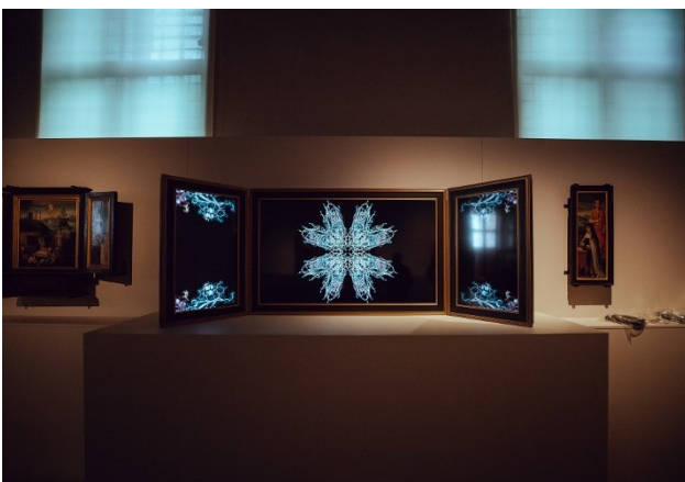
Laura Splan - Disentanglement, 2021