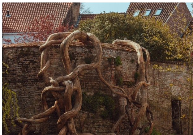
Henrique Oliveira - Banisteria Caapi (Desnatureza 4), 2021, VALLOIS, Paris; Van de Weghe, New York