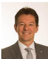
Johan Thijs, Groeps-CEO:

Wij willen veel meer zijn dan alleen maar een bank en een verzekeraar. We willen de dromen van onze klanten mogelijk maken en beschermen en hun vertrouwen blijven verdienen. We blijven ernaar streven om hun een uitstekende service te bieden. De sterke start van onze activiteiten in 2016 getuigt daarvan. Onze krediet- en depositovolumes en de verkoop van verzekeringen namen toe en ook de lage kredietkosten ondersteunden het nettoresultaat. Tegen een achtergrond van aanhoudend lage rente, bescheiden economische groei in België en een stevigere groei in Centraal-Europa, begon KBC het jaar 2016 met een sterke nettowinst van 392 miljoen euro voor het eerste kwartaal, ten opzichte van een uitzonderlijke 862 miljoen euro in het voorgaande kwartaal en een erg sterke 510 miljoen euro in het eerste kwartaal van 2015. De winst in het eerste kwartaal van 2016 is het resultaat van stabiele totale opbrengsten van onze traditionele bedrijfsactiviteiten, lagere operationele kosten, hogere upfront geboekte bankenheffingen en een erg laag niveau van waardeverminderingen op kredieten.