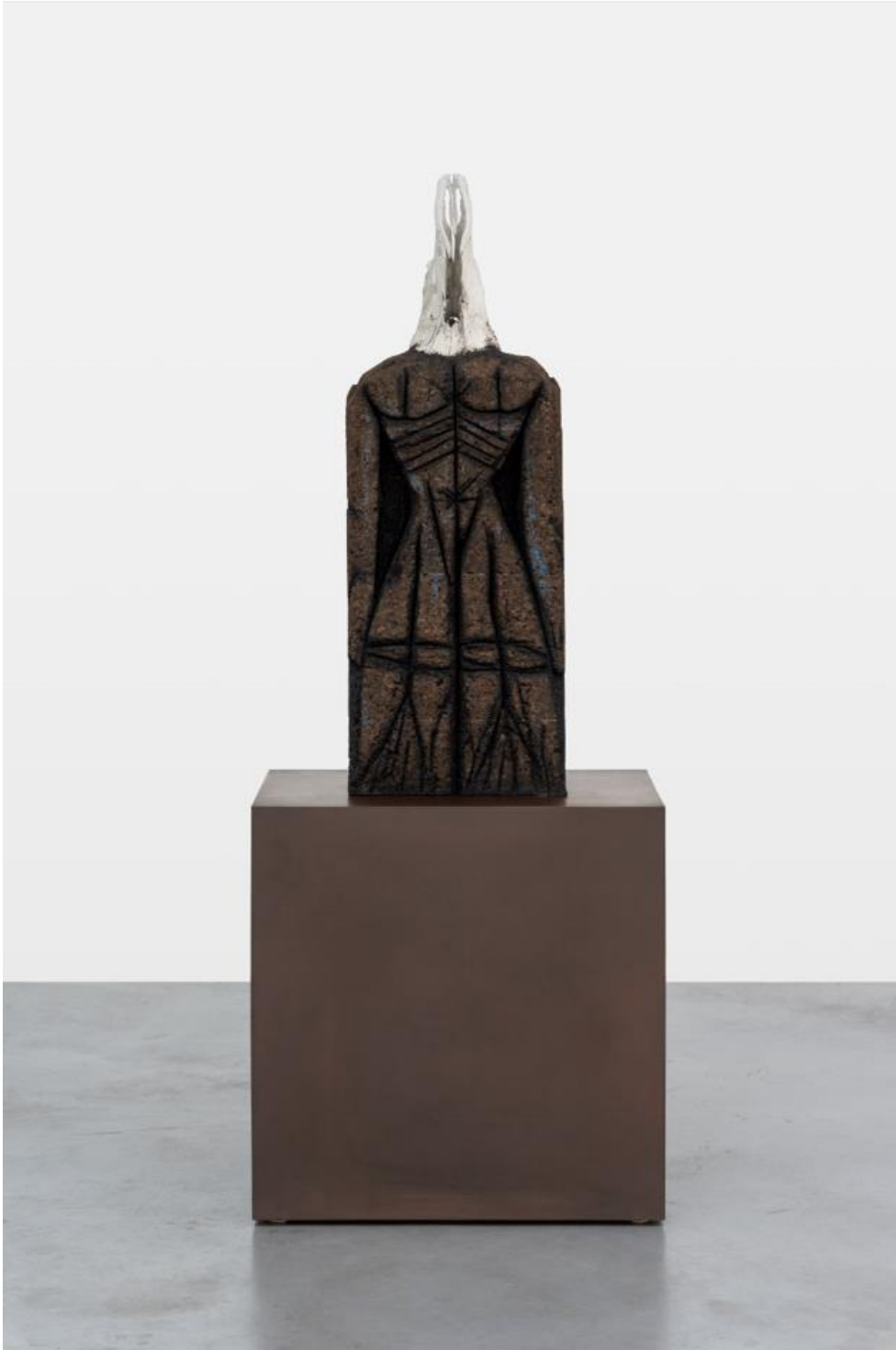
'Present', Huma Bhabha, 2022.