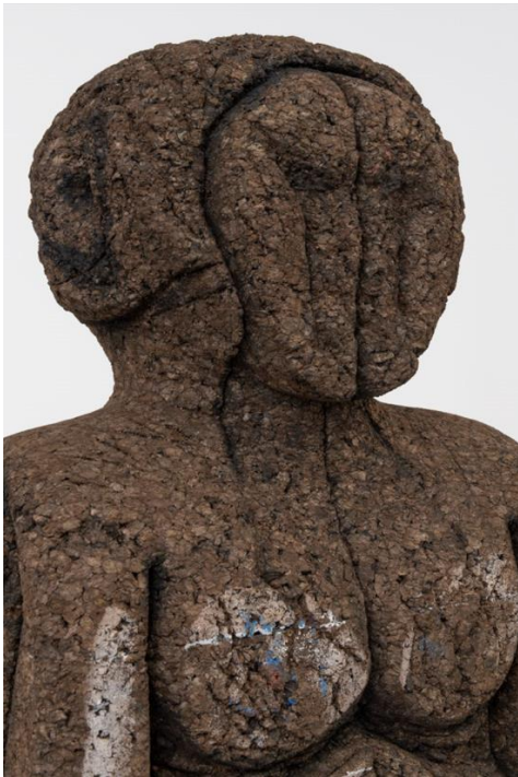
'The Ambitious One' (detail), Huma Bhabha, 2021, private collection. Courtesy of the artist & Xavier Hufkens, Brussels