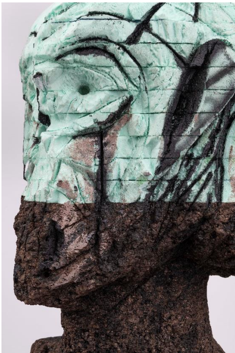
'I was Invited' (detail), Huma Bhabha, 2020, T&C Collection.