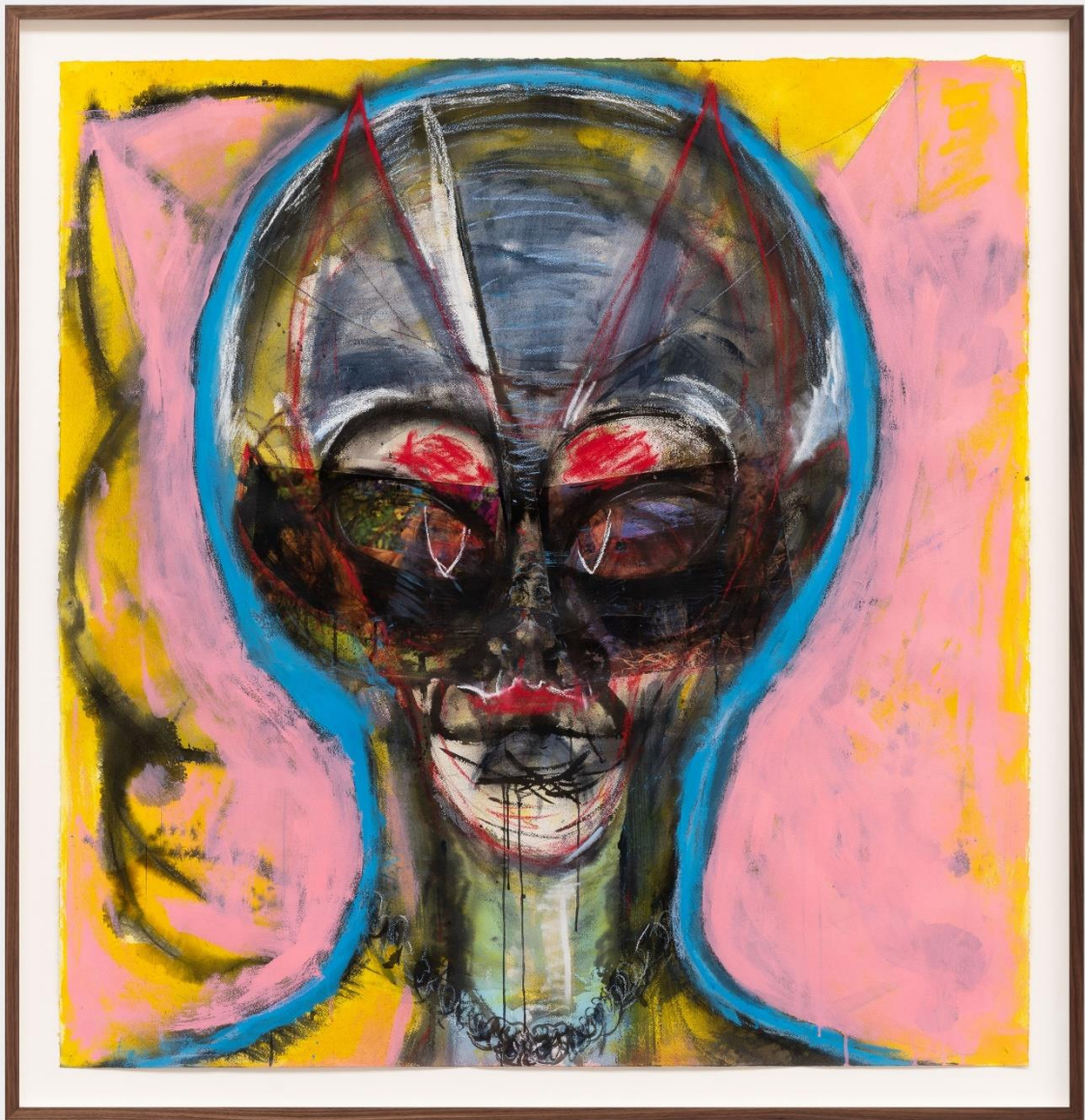
Untitled, Huma Bhabha, 2021, private collection.