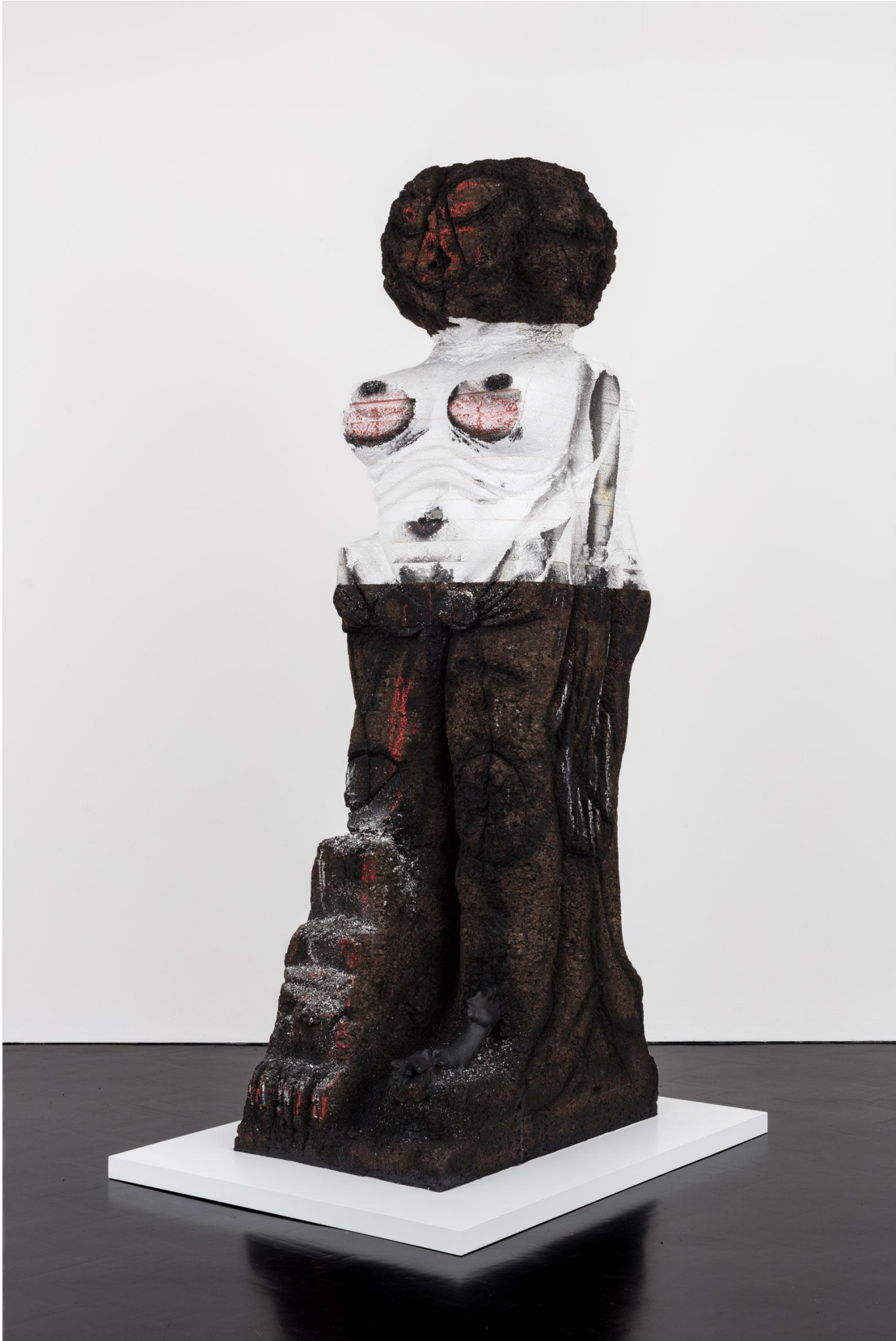
'Castle of the Daughter', Huma Bhabha, 2016.