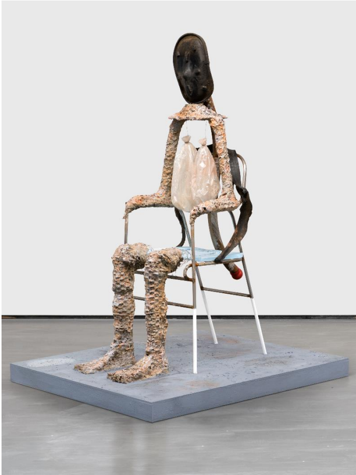
'Mask of Dimitrios', Huma Bhabha, 2019.