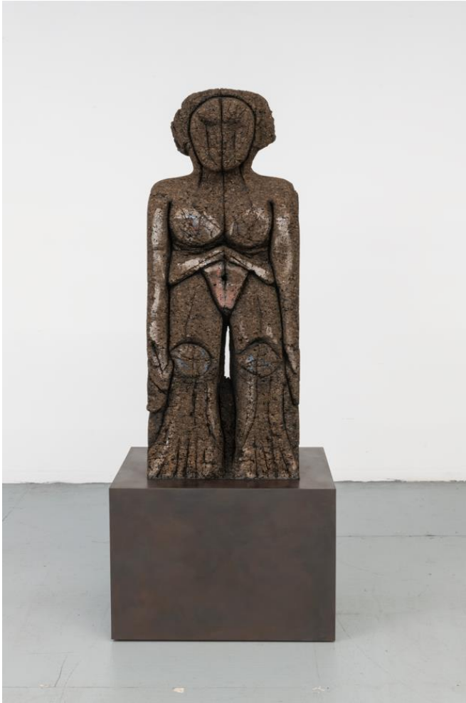
'The Ambitious One', Huma Bhabha, 2021, private collection.