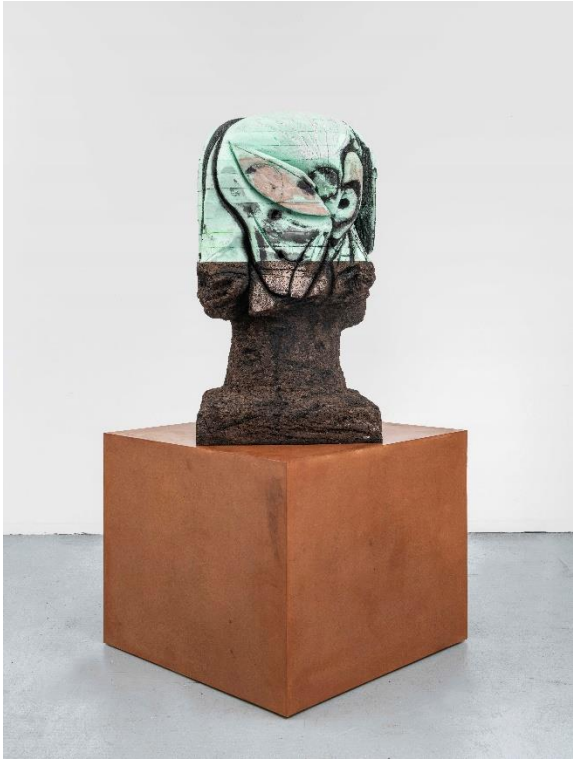
'I was Invited', Huma Bhabha, 2020, T&C Collection.