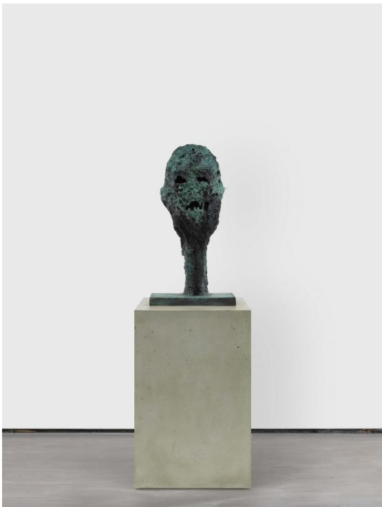
'The Ancient and Arcane', Huma Bhabha, 2021, Collection Michel Urbain.