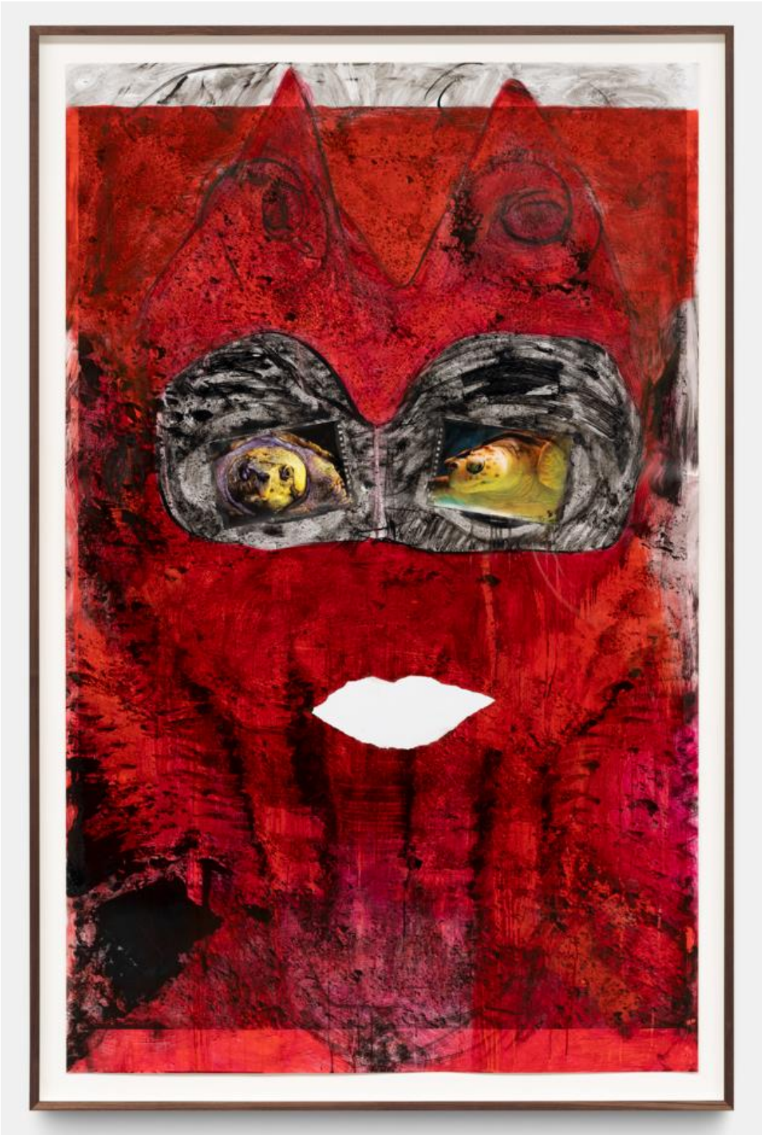
Untitled, Huma Bhabha, 2021, Collection Mario Testino. Courtesy of the artist & Xavier Hufkens, Brussels, photo: Adam Reich