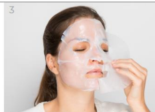
Retira la película protectora exterior