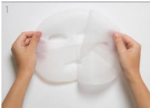
Despliega la máscara y retira la película protectora interior