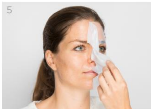
Retira la máscara