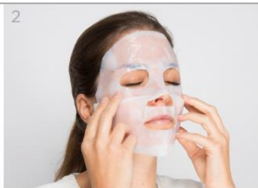
Coloca la máscara ajustándola a la altura de los ojos