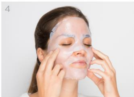
Adapta la máscara y déjala actuar 20 minutos