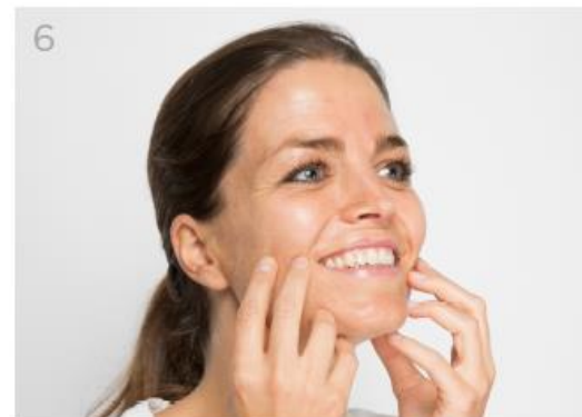
Reparte el serum restante con un suave masaje