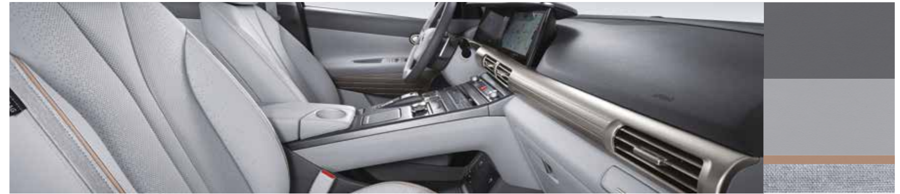
Intérieur Gray Bi-Tone