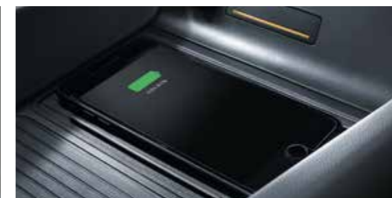
Chargement sans fil