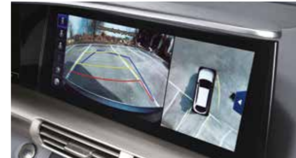
caméras d'environnement 360°