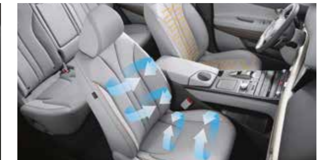
Sièges ventilés et chauffants avant