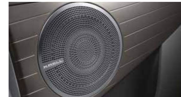
KRELL premium sound