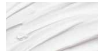
White cream/Mica (TW3)