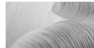
Cocoon silver/Métallisée (V3S)