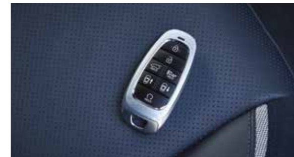
Smart key (stationnement à distance)