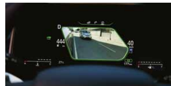
Blind-spot view monitor