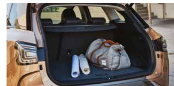
Un coffre spacieux