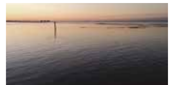
Dusky Blue/Mica (XB3)