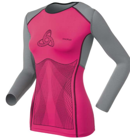
Art. 150101 Shirt Muscle Force

http://clients.freshfocus.ch/CMDB/?action=301;query=:gid=10 Login: Odlo Wachtwoord: Odlo1946