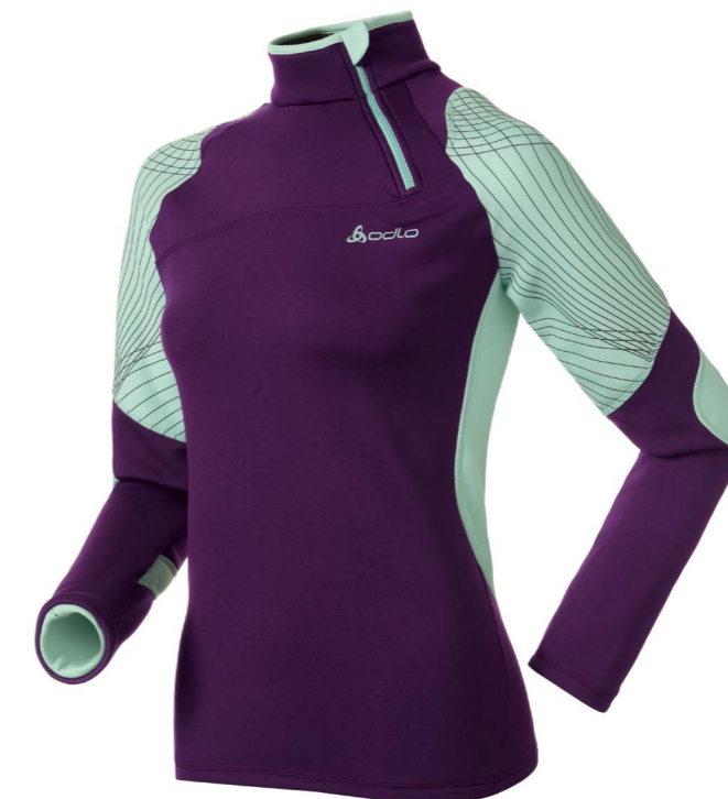
Art. 221001 Ladies's Stand-up collar Energetic