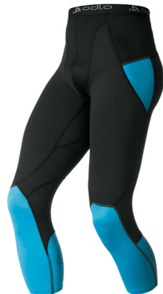
Art. 158112 Pants Muscle Force