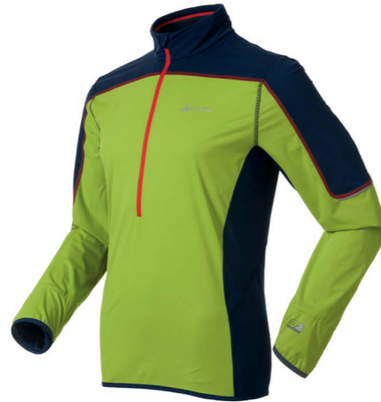
Art. 346992 Men's Jacket midlayer Aliseo

Foto's: http://clients.freshfocus.ch/CMDB/?action=301;query=:gid=10 Login: Odlo Wachtwoord: Odlo1946