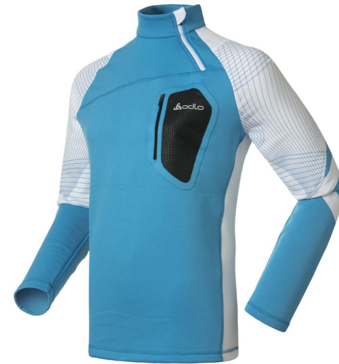
Art. 221212 Men's Stand-up collar Energetic

http://clients.freshfocus.ch/CMDB/?action=301;query=:gid=10 Login: Odlo Wachtwoord: Odlo1946