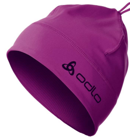
Art. 772040 Hat Polyknit