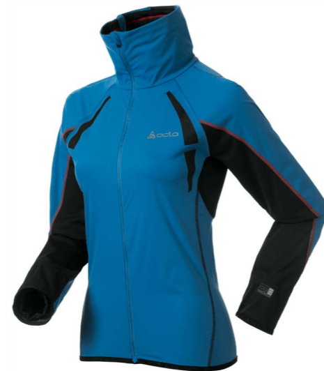
Art. 346991 Women's Jacket midlayer Alisea