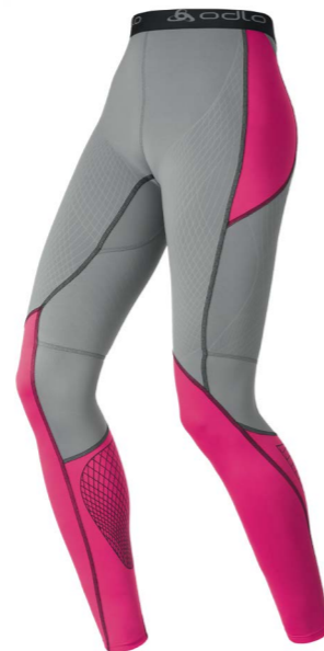
Art.158121 Pants Muscle Force