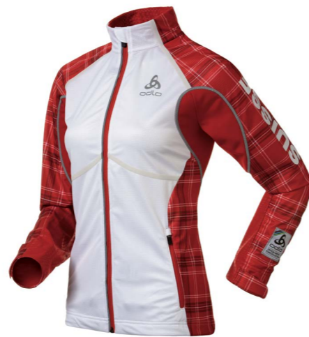
Art. 612031 Women's Jacket Frequency X Suisse

http://clients.freshfocus.ch/CMDB/?action=301;query=:gid=10 Login: Odlo Wachtwoord: Odlo1946