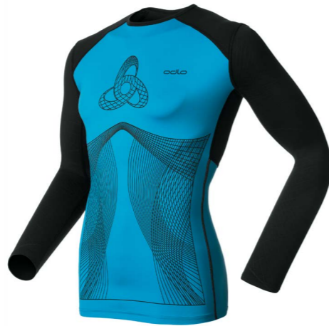
Art. 158102 Shirt Muscle Force

Foto's: http://clients.freshfocus.ch/CMDB/?action=301;query=:gid=10 Login: Odlo Wachtwoord: Odlo1946