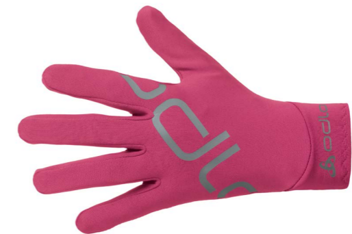
Art. 792120 Gloves Intensity