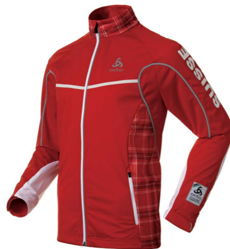
Art. 612032 Men's Jacket Frequency X Suisse