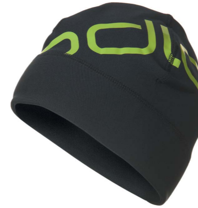
Art. 791890 Hat Intensity

http://clients.freshfocus.ch/CMDB/?action=301;query=:gid=10 Login: Odlo Wachtwoord: Odlo1946