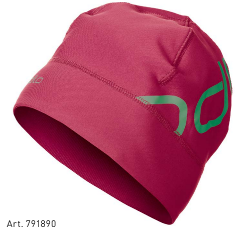
Art. 791890 Hat Intensity