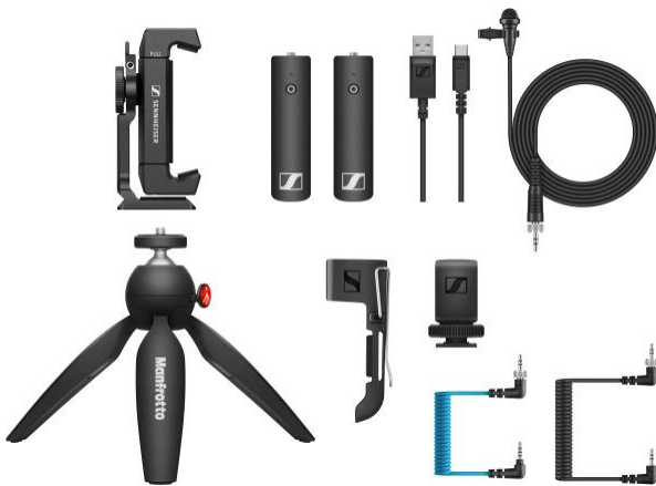
XSW-D Portable Lav Mobile Kit mit dem neuen XSW-D Mobile-Kabel.

Die kabellose Lavalier-Lösung von Sennheiser wird nicht nur mit Smartphone-Klemme und Mini-Stativ geliefert, sie enthält auch ein zusätzliches TRS-TRS-Kabel für den Anschluss an Smartphones (auch separat als XSW-D Mobile-Kabel erhältlich). Dieses spezielle Kabel ist mit einem Dämpfungsglied ausgestattet, um optimale Pegel für mobile Geräte zu gewährleisten.