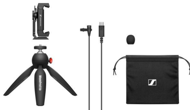
XS Lav USB-C Mobile Kit

Dieses Kit ergänzt das kabelgebundene USB-C-Lavalier-Mikrofon von Sennheiser um eine Smartphone-Klemme und das PIXI – so wird es zum idealen Video- und Podcasting-Bundle.