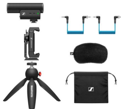
MKE 400 Mobile Kit