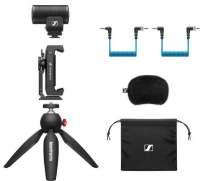
MKE 200 Mobile Kit

Da für Videoaufnahmen oft verschiedene Geräte verwendet werden, enthalten sowohl das MKE 200 als auch das MKE 400 3,5 mm TRS- und TRRS-Kabel für die Nutzung mit DSLR/M-Kameras bzw. mobilen Geräten. Mit Smartphone-Klemme und Manfrotto PIXI rüsten die verschiedenen Mobile-Kit-Varianten Videoproduzenten für alle Aufnahmesituationen.