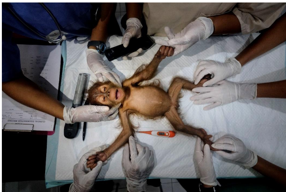
Saving Orangutangs – Alain Schroeder

De Stories Award gaat naar Alain Schroeder die met zijn reportage “ Saving Orangutangs ” een pakkend en maatschappelijk relevant verhaal weet te vertellen. Hij weet op een meesterlijke manier de foto’s te kaderen; elke foto is technisch perfect, wat de continuïteit in het verhaal nog versterkt. De jury was vol lof: “ Het is een documentair en journalistiek meesterwerk. ”