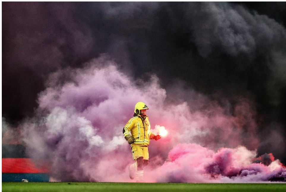
Le Clasico en feu – Bruno Fahy