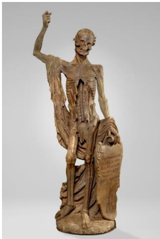
3. Ile-de-France, Allegorie van De dood ('La Mort Saint Innocent') , ca. 1530, albast Musee du Louvre, Parijs