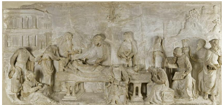
4. Giovanni di Giusto di Betti (Jean Juste), De Dood van Maria , ca. 1530–40, albast Musee du Louvre, Parijs