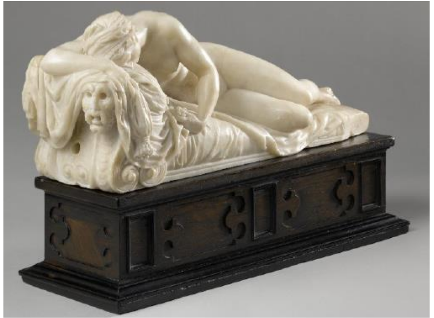
6. Toegeschreven aan Willem van den Broecke (‘Guglielmus Paludanus’), Slapende Nimf , 1555-60, albast