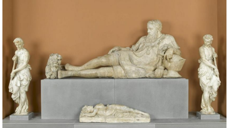
2. Naar een model van Jean Cousin, Grafmonument van Philippe Chabot , ca. 1543–1570, albast Musee du Louvre, Parijs