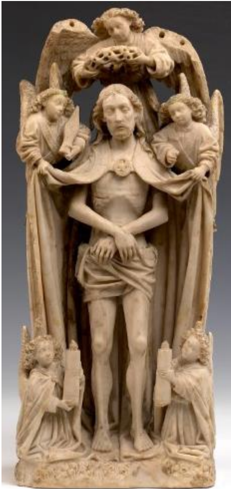
5. Zuidelijke Nederlanden, Man van Smarten ,