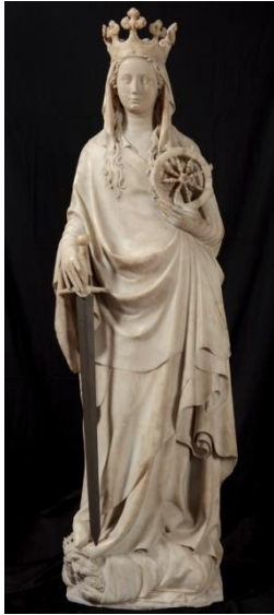
1. Andre Beauneveu, Sint-Catharina van Alexandrië, 1374–86, albast Onze-Lieve-Vrouwekerk, Kortrijk