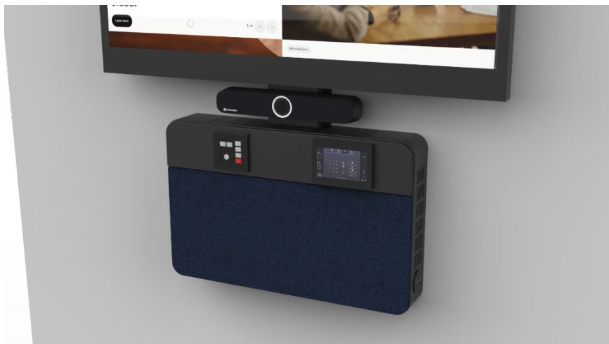
Zoom sur la TC Bar S avec ALT

design ergonomique, il facilite l'accès aux équipements, simplifie l'intégration et garantit une maintenance efficace. Lorsqu'il est combiné aux TC Bar Solutions, TeamMate transforme les espaces collaboratifs en environnements intuitifs et hautement performants.