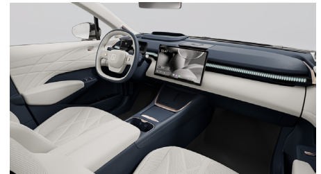
Sellerie cuir synthétique Midnight Blue et Polar White (Option sur Privilège)

*Consommation d'énergie combinée du Zeekr X en kWh/100 km : 17,4 - 18,1 (WLTP), émissions de CO 2 combinées en g/km : 0, consommation de carburant combinée en l/100 km : 0. Les chiffres sont basés sur l'homologation WLTP. L'autonomie électrique est influencée par des facteurs incluant, mais sans s'y limiter, le style de conduite et les conditions routières. Les temps de charge peuvent varier en fonction de la puissance fournie.