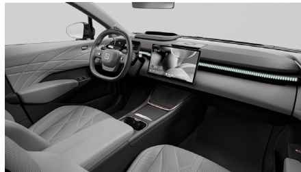
Sellerie cuir synthétique Charcoal Black et Stone Grey (De série dans le modèle Privilège)