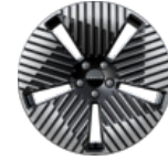
Jantes en alliage 19 pouces Aero (de série sur Core)