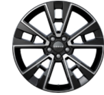
Jantes en alliage 19 pouces multi-branches (De série sur Long Range)