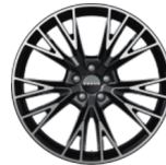
Jantes en alliage 20 pouces multi-branches (de série sur Privilège)