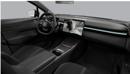
Sellerie tissus Charcoal Black Intérieur Bermuda Slope (De série pour le modèle de base et le modèle longue portée)