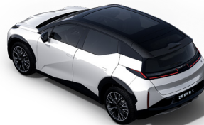
Toit noir contrasté (De série sur Long Range et Privilège uniquement)