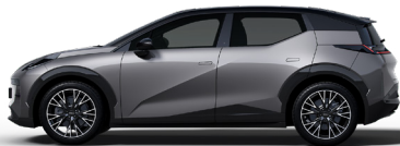
Grid Grey (Option)