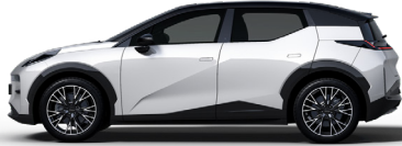
Crystal White (Standard)