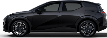
Onyx Black (Option)