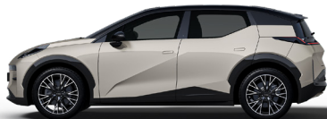
Palace Beige (Option, pas sur Core)