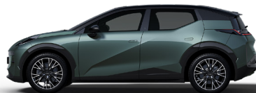
Pine Green (Option, pas sur Core)