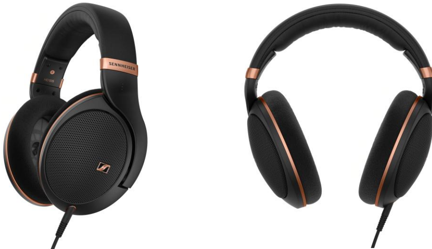
Abbildung: Der HD 505 bietet eine überzeugende Möglichkeit, in das audiophile Hörerlebnis einzutauchen

Dadurch können Nutzer*innen ihre Lieblingsmusik, -filme und -spiele erleben, als säßen sie in der ersten Reihe.