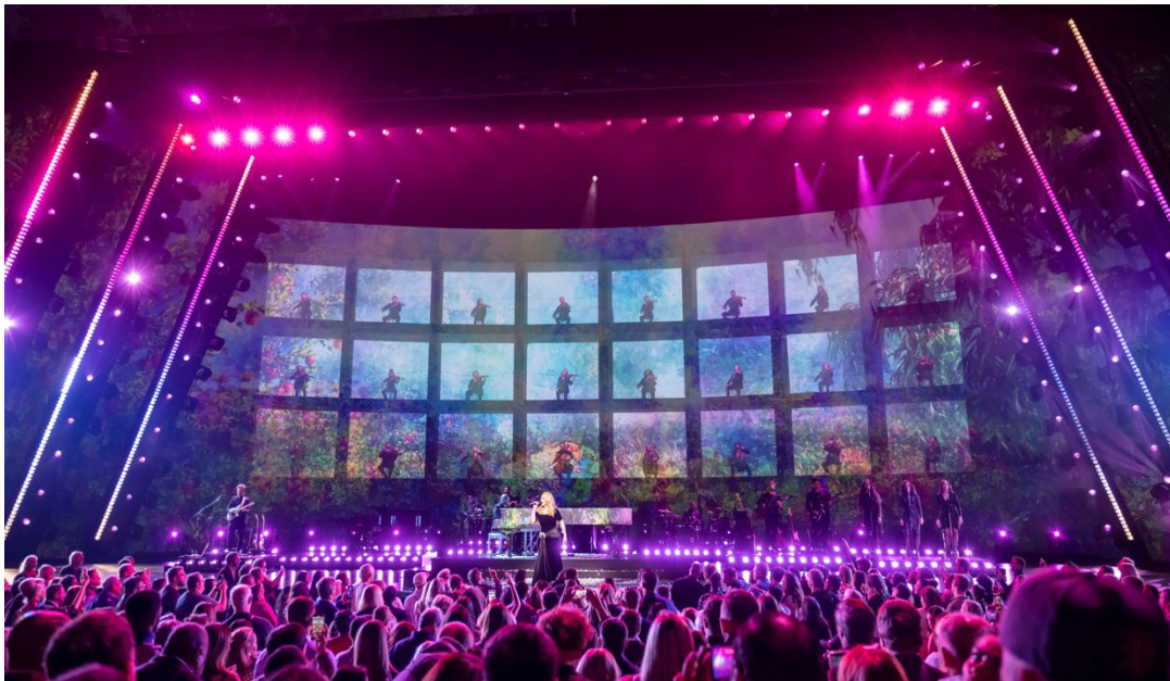
“与 Adele 共度周末” (“Weekends with Adele”) 舞台设计，背景是弦乐团队，图源：STUFISH

“与 Adele 共度周末”是英国歌手 Adele 的首次驻场音乐会演出。音乐会场地选在拉斯维加斯的凯撒宫竞技场 (Caesars Palace Colosseum)，演出从 2022 年 11 月 18 日持续到 2023 年 3 月 25 日，音乐会采用沉浸式音频调音，获得各方一致好评，堪称视听盛宴。