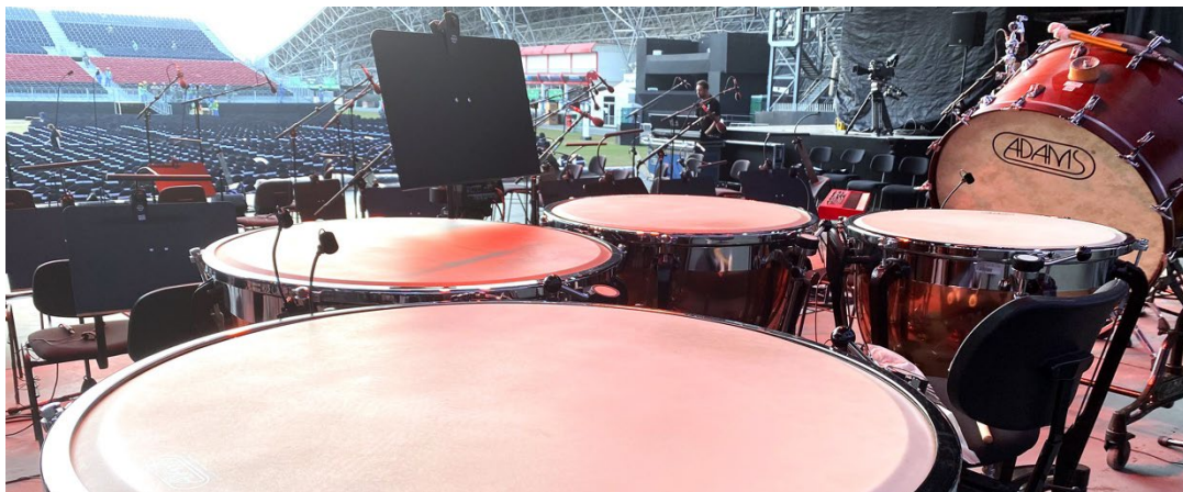
阿布扎比阿提哈德公园 (Etihad Park)，定音鼓已安装好 MCM，等待开演