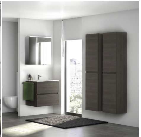
Molto solo in eik grijs met kunstmarmor tablet