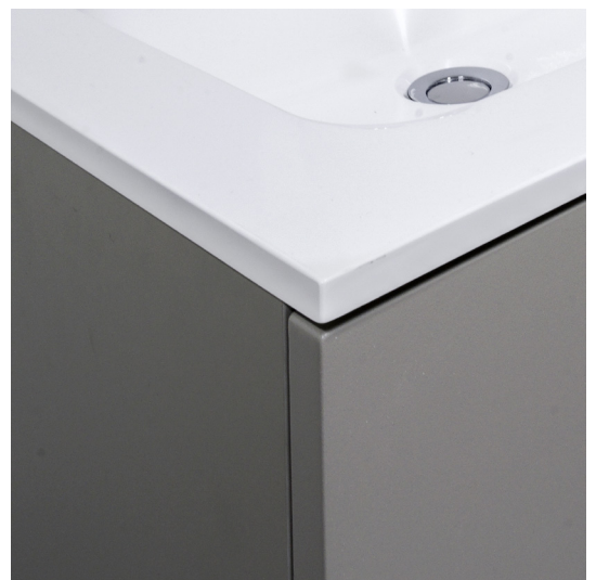
Molto poedergrijs met kunstmarmer tablet