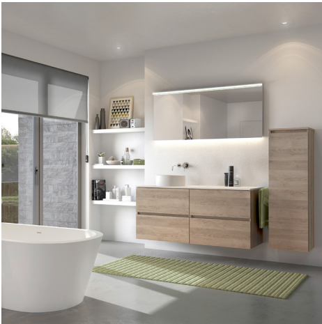
Molto solo in eik natuur met solid tablet