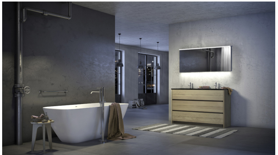
Molto duo in massif eik met blue belge tablet