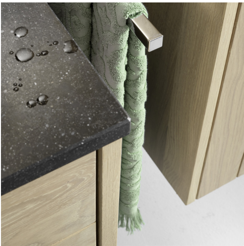
Molto in massif eik met blue belge tablet

Mag het wat meer zijn in je badkamer? Molto, de nieuwste collectie van badkamerspecialist Desco, biedt het gedroomde antwoord voor wie meerwaarde zoekt. De verrassing in de collectie? De keuze tussen single- of duo-oplossingen, ideaal voor vrijgezellen of koppels. Met meer kleuren, meer fronten en meer variatie helpt Molto je aan een interieur aangepast aan jouw leven.