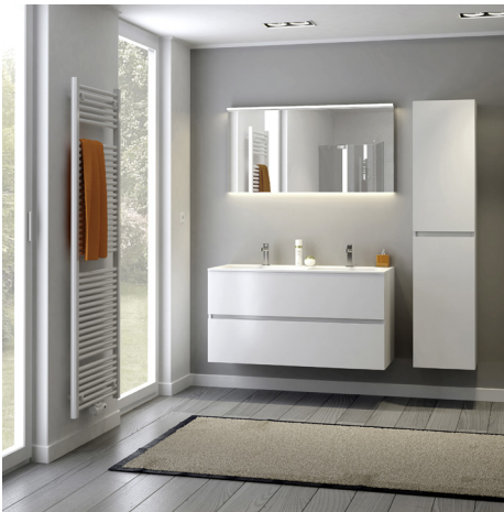
Molto duo in poederwit met porselein tablet