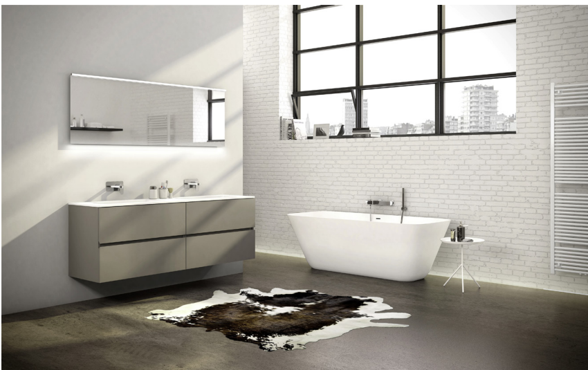
Molto duo in poedergrijs met solid tablet

Welke optie je ook verkiest, je rekent steeds op opbergruimte waar jij het wil. Verrassend ruime verticale kolomkasten, handige opbouwlababo's en onderkasten of een extra kast achter de spiegel... Het maakt Molto persoonlijk én functioneel.