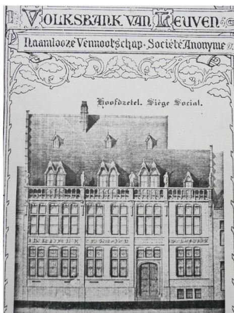
Dessin du bâtiment Helleputte, façade Muntstraat (sans source, sans date)