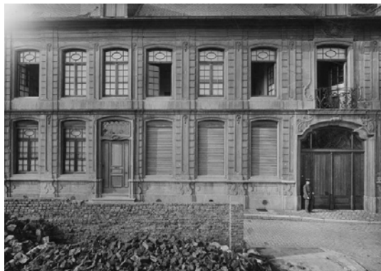
Hôtel d'Eynatten, façade Eikstraat, probablement au début du 20 e siècle

Vers le 14 e , début du 15 e siècle, le bâtiment le long de l'Eikstraat était déjà habité. En 1654, la famille Eynatten devint propriétaire de la maison. Puis, en 1760, la maison devint la propriété de la famille Billoen. Cette date est indiquée au-dessus de la porte.