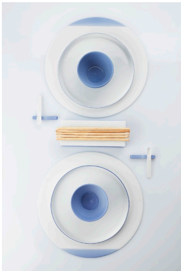
Ontwerp: Piet Stockmans

De Studio maakt servies in kleine, unieke collecties die allen met de hand vervaardigd worden in het atelier in Genk, en die door iedereen kunnen aangekocht worden in de shop of online.