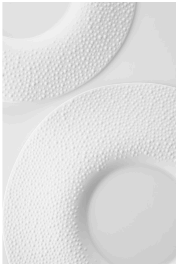
Ontwerp: Frank Claessen