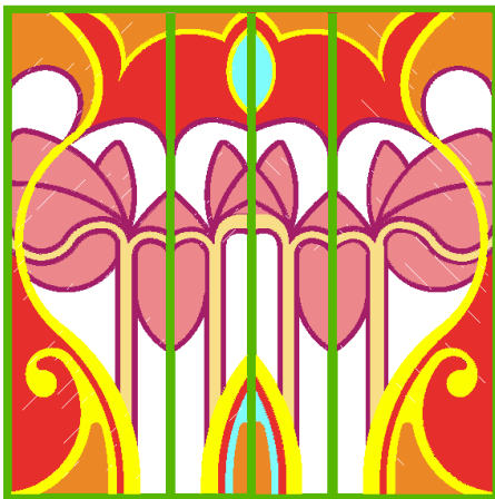
FLOWERCARPET: SKYTREE TOKYO JAPAN

Ce mouvement artistique, né de la créativité du célèbre architecte belge Victor Horta, a déjà servi d'inspiration pour le design du Tapis de Fleurs de Bruxelles en 2004.