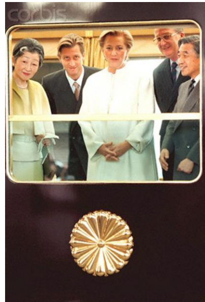
Visite d'Etat au Japon du Roi Albert II et de la Reine Paola - 1996