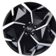
19" Lichtmetalen Velgen