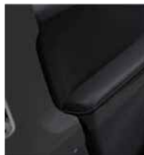
Zwart (stoffen of lederen° zetels)