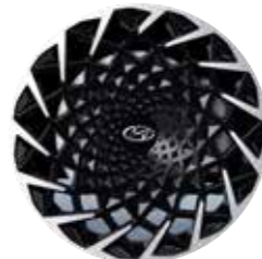
20" Lichtmetalen Velgen