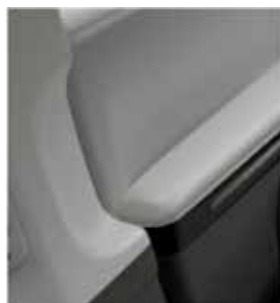
Grijs (keuze op lederen° zetels)

*Leder op Balance, Balance Vision en Balance Solar