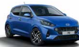
Champion Blue U2U/U24*