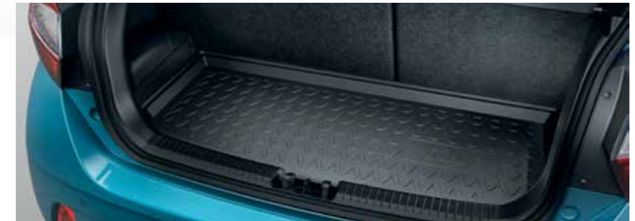
Protection de coffre en caoutchouc