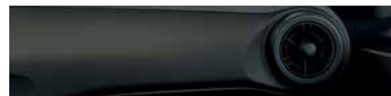
Obsidian Black (Air)