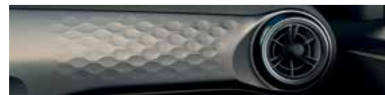
Brass Metal (Sky)