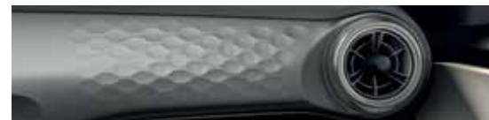
Shale Grey (Sky)