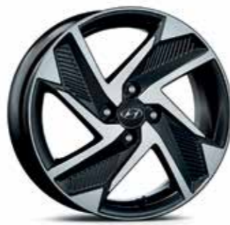
Jantes en alliage léger 16"