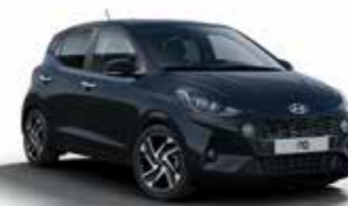
Phantom Black X5B