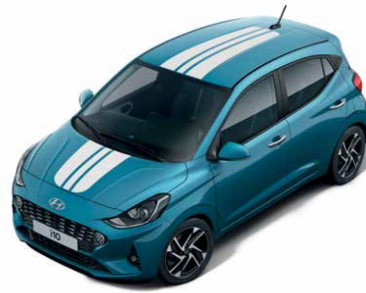
Bandes de course 1

Les valeurs de consommations et d'émissions CO 2 WLTP non connues ou sous réserve d'approbation définitive (telles que connues par le représentant belge de Hyundai au moment de la mise sous presse). Les valeurs individuelles sont déterminées en fonction de la version, des options d'équipements et des accessoires montés sur le véhicule.