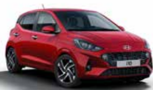
Dragon Red WR7/WR4*