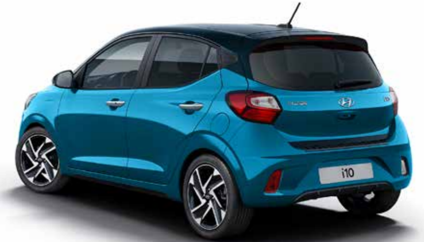
Protection de pare-chocs