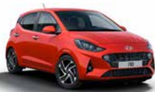
Tomato Red TTR/TT4*