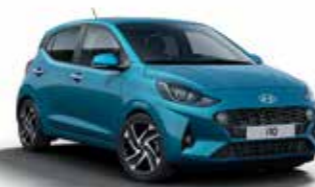
Aqua Turquoise U3H/U34*