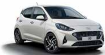
Polar White PSW/PS4*