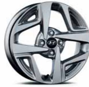
Jantes en alliage léger 15"