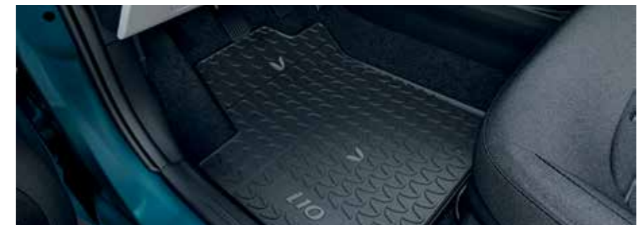
Tapis en caoutchouc

Découvrez notre large gamme d'accessoires chez votre distributeur Hyundai ou sur hyundai.be/accessoires