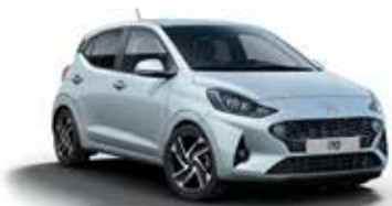
Clean Slate UB2/UB4*