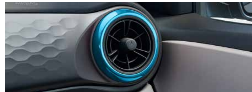
Grille de ventilation colorée 2