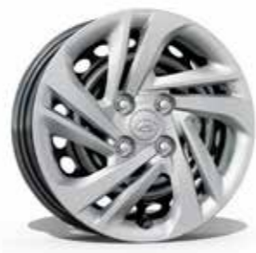
Jantes en alliage léger 14"