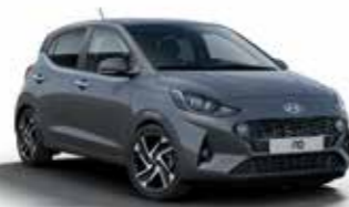
Star Dust V3G