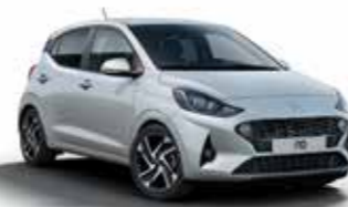
Sleek Silver RYS/R4*