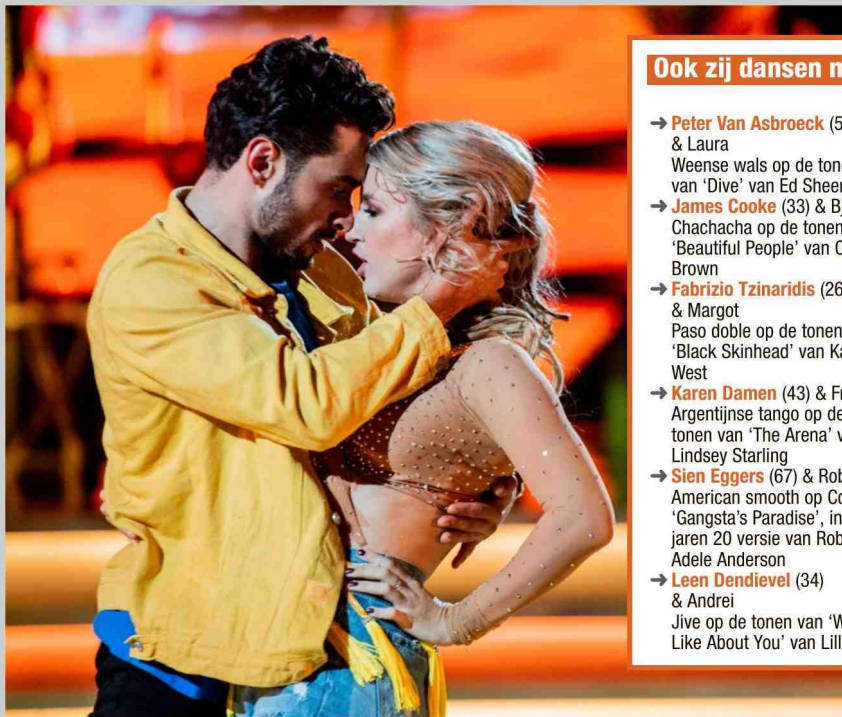
Kat Kerkhofs danst vanavond een Samba op 'Mi Gente' van J Balvin en Willy William.

"Ik heb al vaak voor hete vuren gestaan en ben het als ex-topspporter gewoon om steeds over mijn pijngrens te gaan. Maar deze blessure had ik echt niet verwacht. Ik word nu goed opgevolgd door het medische team en we evalueren de situatie van dag tot dag. Maar heel eerlijk: ik weet niet hoe dit zal aflopen", zegt ze.