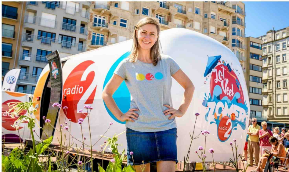
'Plage préférée' is niet meer mogelijk wanneer de VRT geen vergoedingen meer mag ophalen als een radiozender op locatie gaat. Zegt de VRT.

De VRT zal geen vergoedingen meer vragen voor sfeerreportages op evenementen. Die maatregel komt er na de heisa over radiozenders die zich laten vergoeden om evenementen live te verslaan. De audit die de N-VA gevraagd had, komt er niet. VALERIE DROEVEN