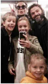
■ Angela Schijf kreeg met Tom Van Landuyt drie dochtertjes.