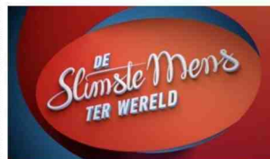
Ontworpen met de slagroomsput.

Gelukkig zijn er ook dingen hetzelfde gebleven. Het decor. Het kenwijsje. De presentator. Zijn lach. Zijn rijmelarijtes. Zijn pogingen om liedjes te zingen. Zijn gescripte gepingpong met de jury. De mopjes met een baard zo lang dat je je afvraagt waarom Gillette deze quiz niet sponsort, in plaats van Delacre (zeg niet dat Delacre niet betaald