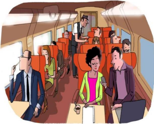
“Comfort”, dat is kiezen voor ruimte (+30 %) en rust.

Met haar nieuwe aanbod zet Thalys haar vertrouwd model op een nieuw spoor. Standard / Comfort / Premium: achter de nieuwe namen schuilt een aanbod dat zich aanpast aan de behoeften van de reizigers, ongeacht de reden van hun reis, hun vertrekpunt of bestemming.