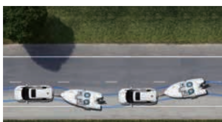
Trailer Sway control

'Powered by Toughness' – C'est ainsi que se définit la vision et la philosophie stylistique de KGM pour ses voitures. Avec ses traits empreints de sérénité et ses détails expressifs, tels que ses feux diurnes LED horizontaux, le Torres EVX affiche un style unique et branché. Ses traits fluides et audacieux génèrent une ligne dynamique et puissante qui perpétue et renforce l'héritage de la marque.