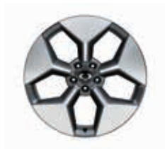
20" en alliage finition Diamond Cut