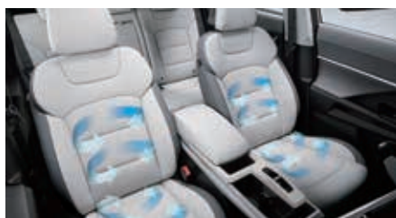
Sièges avant ventilés