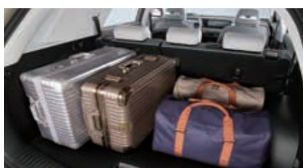
Volume de chargement standard de 703 litres