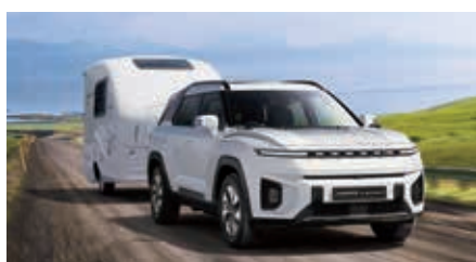
Capacité de remorquage jusqu'à 1500 kg