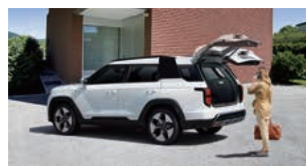
Hayon arrière à commande électrique