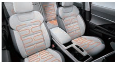
Sièges avant et arrière chauffants