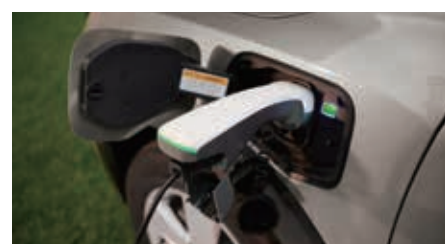
Fonctionnalité V2L (Vehicle-to-Load)