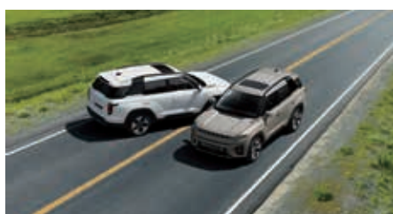
Multi Collision Brake (MCB)