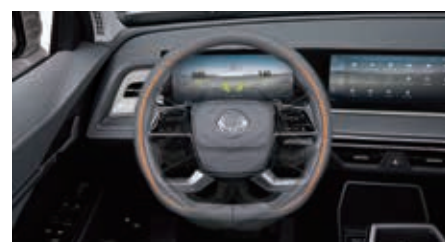
Volant chauffant et gainé de cuir