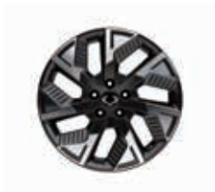
18" en alliage finition Diamond Cut