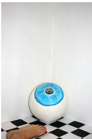
Installation shot 02, 2019 © Doris Boerman

L'année dernière, Doris Boerman s'est concentrée sur les aspects croisés entre la personne en tant que modèle de présentation de soi, et l'espace d'exposition en tant que modèle de présentation de l'art. L'imbrication des aspects matériels, par exemple, du vêtement et de la peinture, des aspects décoratifs tels que les bijoux ou les encadrements, et l'assimilation du mur d'exposition à la peau d'une personne fait partie de son vocabulaire visuel. Depuis peu, elle intègre la performance à son travail dans la perspective de connecter performeurs et œuvre exposée.