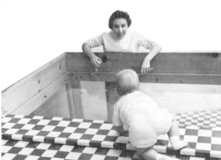
Visual cliff experiment. From Gibson and Walk Jaar 1960