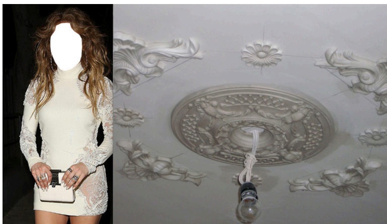
En Public, 2019