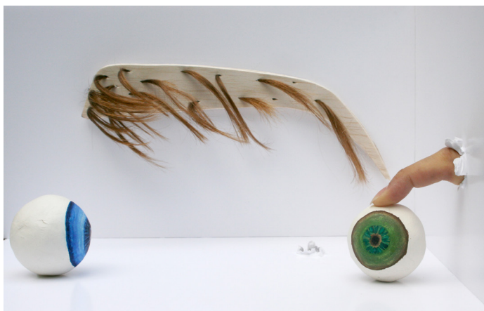
Installation shot 01, 2019 © Doris Boerman