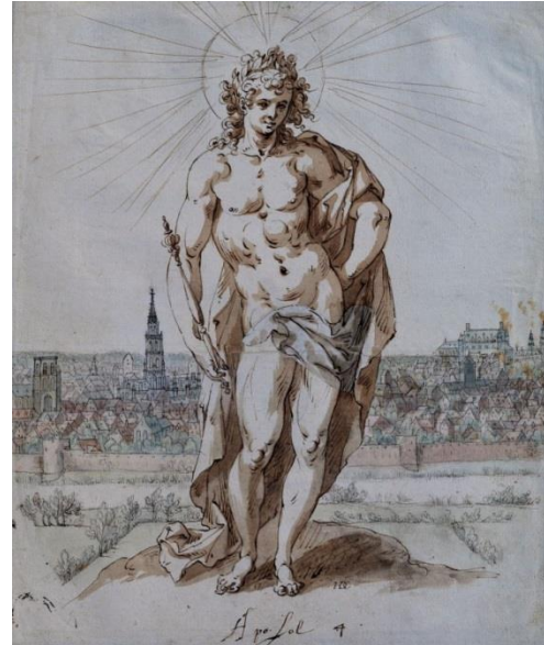
Hendrick De Clerck, Venus en Apollo

Hendrick De Clerck stelt de planetengoden voor in een doorlopend stadsgezicht op Brussel. Met de goddelijke aartshertogen als vorsten moet Brussel immers wel het centrum van het universum zijn. Van hieruit heerst Albrecht als een nieuwe Apollo over de hele kosmos. Onder zijn beleid worden de Nederlanden een nieuw aards paradijs. De Clerck toont Venus in het gezelschap van haar zoon, de kleine Cupido. Doorgaans staat Venus symbool voor de passionele liefde, maar nu laat ze zich niet gek maken door de pijlen van haar zoon. Het rad in haar handen verwijst naar het rad van de fortuin. Er is echter een manier om aan haar nukken te ontkomen en dat is: rationeel zijn. Wie zich, met andere woorden, verzet tegen de passionele liefde en zowel in goede als in kwade tijden rationeel is, zal triomferen op het lot. Het spreekt voor zich dat dat voor Albrecht en Isabella van toepassing is.