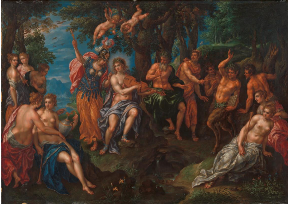
Hendrick De Clerck, De wedstrijd tussen Apollo en Pan

Omstreeks 1600 schildert De Clerck een Midasoordeel . In plaats van te focussen op de muziekwedstrijd tussen de zonnegod Apollo en Pan, de beschermer van de woeste natuur, voegt hij Minerva toe. Samen met Apollo vormt ze het stralende middelpunt van de compositie. Albrecht wordt zo de nieuwe Apollo of zonnekoning die regeert met Isabella als wijze Minerva. Dat is ook de sleutel tot dit schilderij: Albrecht en Isabella zullen triomferen en de dierlijke driften van Pan weerstaan. Door het pad van de rede te volgen, zullen ze beloond worden met eeuwige roem.