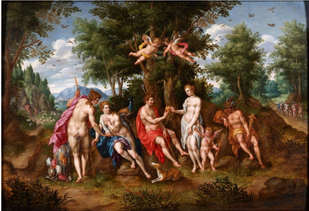
Hendrick De Clerck, Parisoordeel

Het Parisoordeel toont de eerste missverkiezing uit de geschiedenis. De herder Paris moet de mooiste godin aanduiden: Juno, Minerva of Venus. Hij kiest voor Venus, met de Trojaanse oorlog als resultaat. Daarmee is het Parisoordeel het antivoorbeeld voor een wijze vorst. Een verstandige heerser kiest niet voor schoonheid, maar voor de wijze Minerva. Met deze voorstelling waarschuwt De Clerck voor dwaasheid en suggereert hij dat Albrecht veel wijzer is dan Paris.