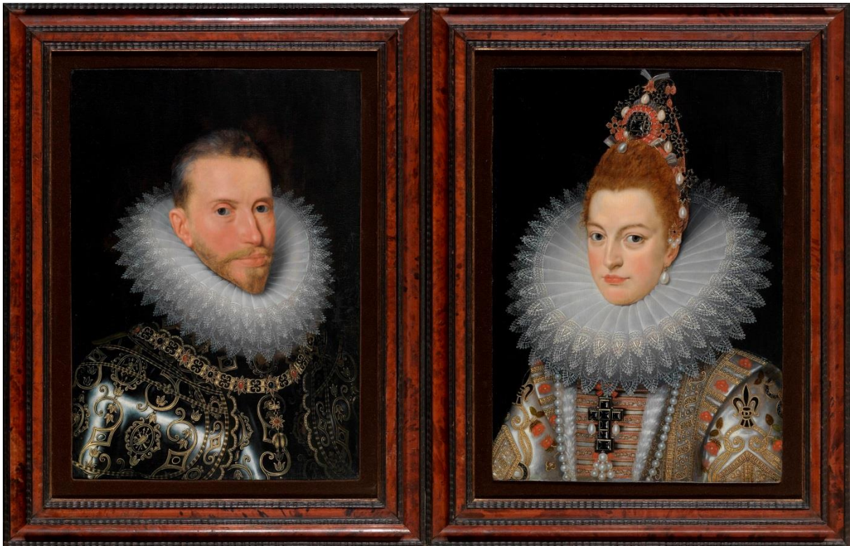
Frans Pourbus II, Portretten van de aartshertogen Albrecht en Isabella, Musea Brugge

In 1595 wordt aartshertog Albrecht van Oostenrijk aangesteld tot gouverneur-generaal van de Nederlanden. De Spaanse koning Filips II heeft grootse plannen met zijn neef. De aartshertog zal trouwen met Filips' lievelingsdochter, de infante Isabella. Zij krijgt als bruidsschat de Spaanse Nederlanden mee. En er is meer. Mocht Isabella's jongere broer – Filips III – voortijdig sterven, dan erft ze het Spaanse wereldrijk. Tegelijk is Albrechts broer, keizer Rudolf II, onderhevig aan melancholische buien. Er wordt dus actief uitgekeken naar een nieuwe keizer. Albrecht zou wel eens de geknipte kandidaat kunnen zijn.