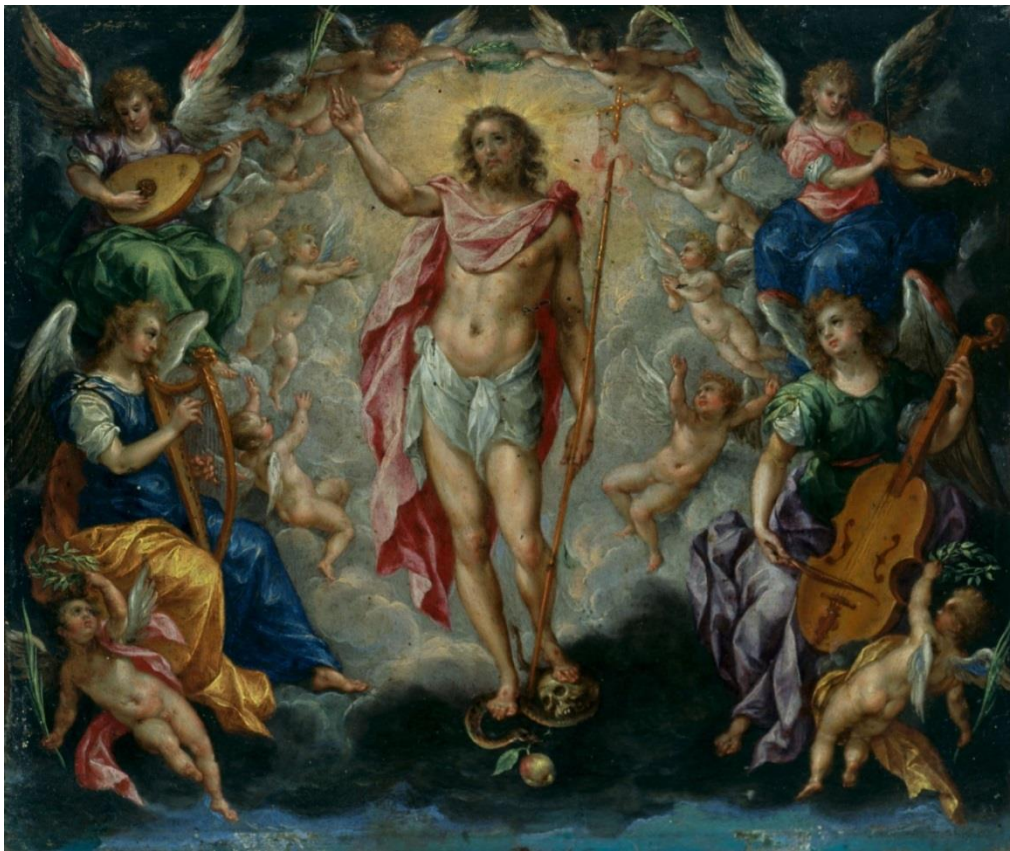
Hendrick De Clerck, Verrezen Christus tussen de musicerende engelen, Landesmuseum Joanneum, Graz

Het Brusselse paleis wordt zo een doorgeefluik tussen hemel en aarde, met de aartshertog in de rol van nieuwe Christus. Ook Isabella heeft een rechtstreekse lijn met de hemel. Zij is als een nieuwe Maagd Maria: ze bidt voor de inwoners van de Nederlanden en God verhoort al haar gebeden.