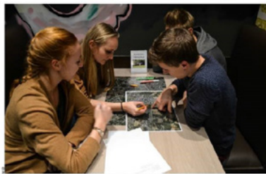
*Jongeren konden op de eerste 'Toogpraat' mee nadelen over het kindvriendelijk gebruik van openbare ruimtes. De Jeugd Raad wil met het nieuwe 'Toogpraat' initiatief zijn werking verbreden. *We vroegen al om een spontaan te glimlachen op een gesprek. *We vinden het belangrijk om

BEVEREN De Jeugd Raad wil in 2017 starten met een proefproject waarbij jongeren zelf meedelen over het kindvriendelijk gebruik van openbare ruimtes. Tijdens de eerste 'Toogpraat' konden leden van verschillende jeugdbewegingen al even meedelen.