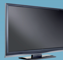
2000 Téléviseur à écran plat