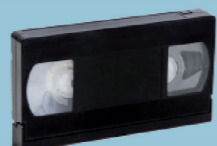
1976 Lancement de la cassette VHS