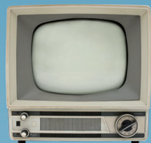
1939 Commercialisation des premiers téléviseurs