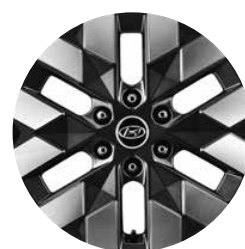
18" Lichtmetalen Velgen (Luxury)