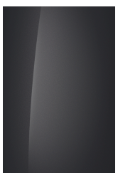
Ecotronic Gray (Mica)