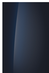
Classy Blue (Mica)