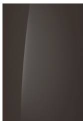
Cast Iron Brown (Metaal)