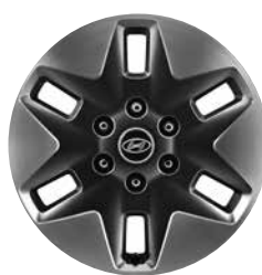
18" Lichtmetalen Velgen (Wagon)