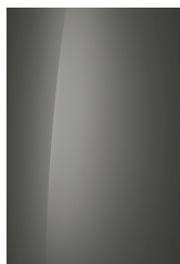
Olivine Gray (Metaal)