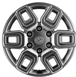
17" Lichtmetalen Velgen (Van/Wagon)