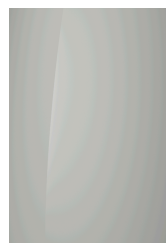
Creamy White (Effen)