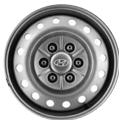
17" Stalen Velgen (Van)