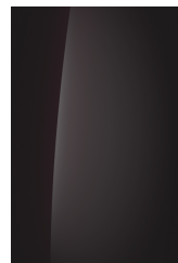
Galaxy Maroon (Mica)

3 JAAR Waarborg Zonder Kilometerbeperking*