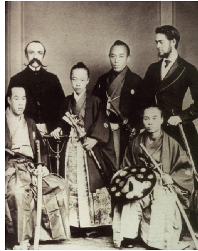
La mission de Tokugawa Akitake reçue par le Roi Léopold II – premier contact officiel entre un représentant japonais et le gouvernement belge - 1867