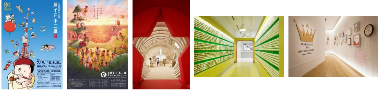
Photo 5: My Margaret Exhibition (Mori Arts Center Gallery). Graphic design (Tokyo, Sep 2014)

“En regardant le documentaire sur le Tapis de Fleurs 2014, j’ai été émerveillée par la chaleur dans les yeux des horticulteurs participants. Leur amour pour les fleurs était flagrant, et je voulais que mon design leur donne un sentiment de fierté et d’accomplissement dans leur travail et pour leurs fleurs.