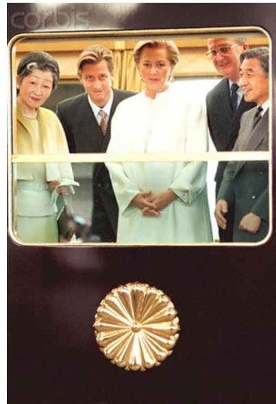
Visite d'Etat au Japon du Roi Albert II et de la Reine Paola - 1996