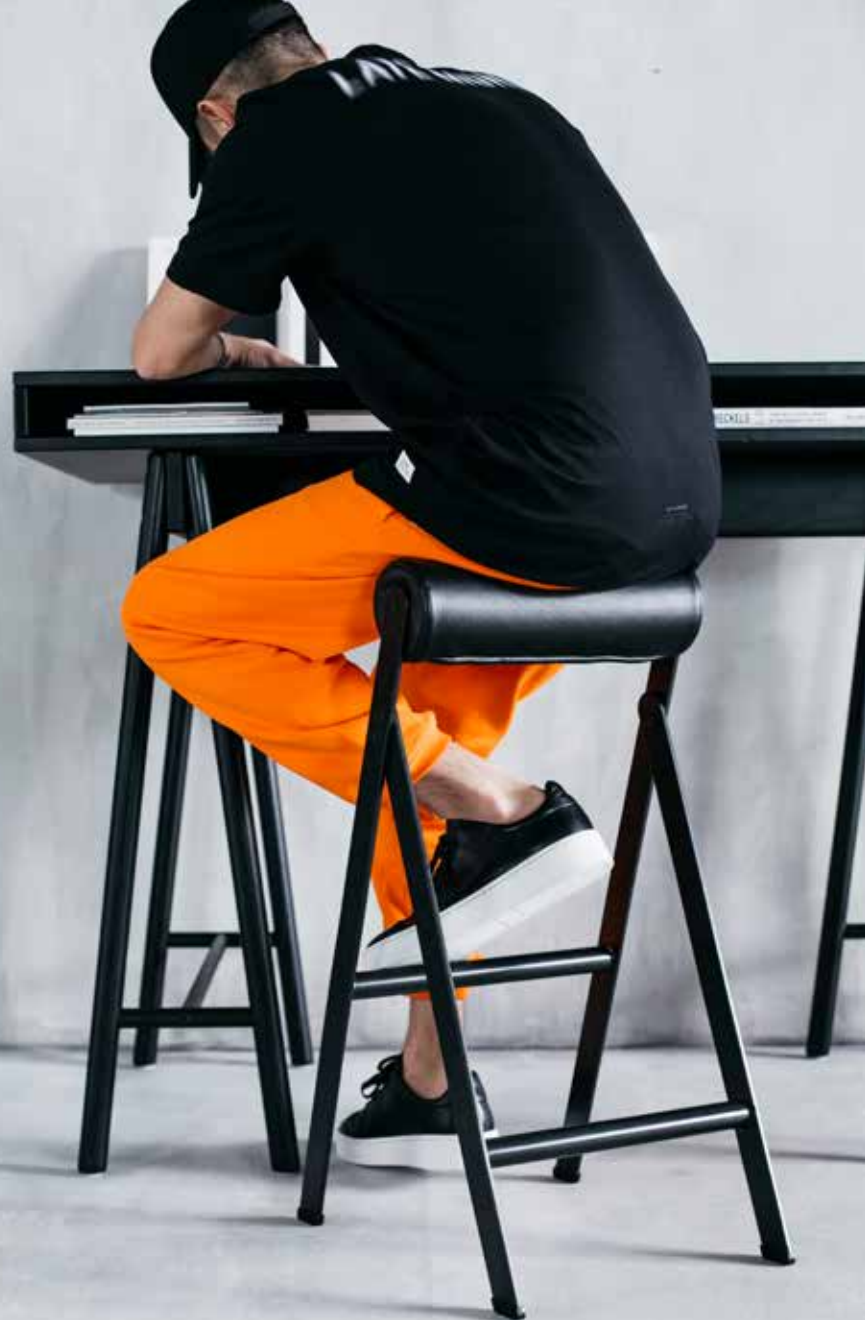
PH149850 SPÄNST zit-/stasteun 69,95 004.120.58

“Een tafel die wat hoger staat moedigt ons aan om staand te werken. Maar toch wil je af en toe even uitrusten. Voor dat ‘tussentijd’ vonden we deze speciale kruk een prima oplossing.”