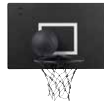
PE663621 SPÄNST basket en bal, binnen 34,99 Aanbevolen vanaf 5 jaar. Acryl, gepoederlakt staal en 100% polypropyleen. 50x35 cm. H 45 cm. 304.001.34