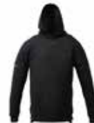
PE672074 SPÄNST hoody, M 24,99 83% katoen, 17% polyester. Zwart. 004.134.54