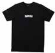
PE663447 SPÄNST T-shirt, S 12,99 100% katoen. Zwart. 804.131.53