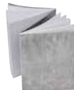
PH149668 SPÄNST tweezijdig notitieboekje 000 Bevat: 30 glijnde en 30 ongelijnde pagina's. Papier. 15x20 cm. Grijs/zwart. 604.082.61