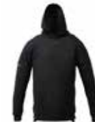
PE672074 SPÄNST hoody, L 24,99 83% katoen, 17% polyester. Zwart. 304.134.57