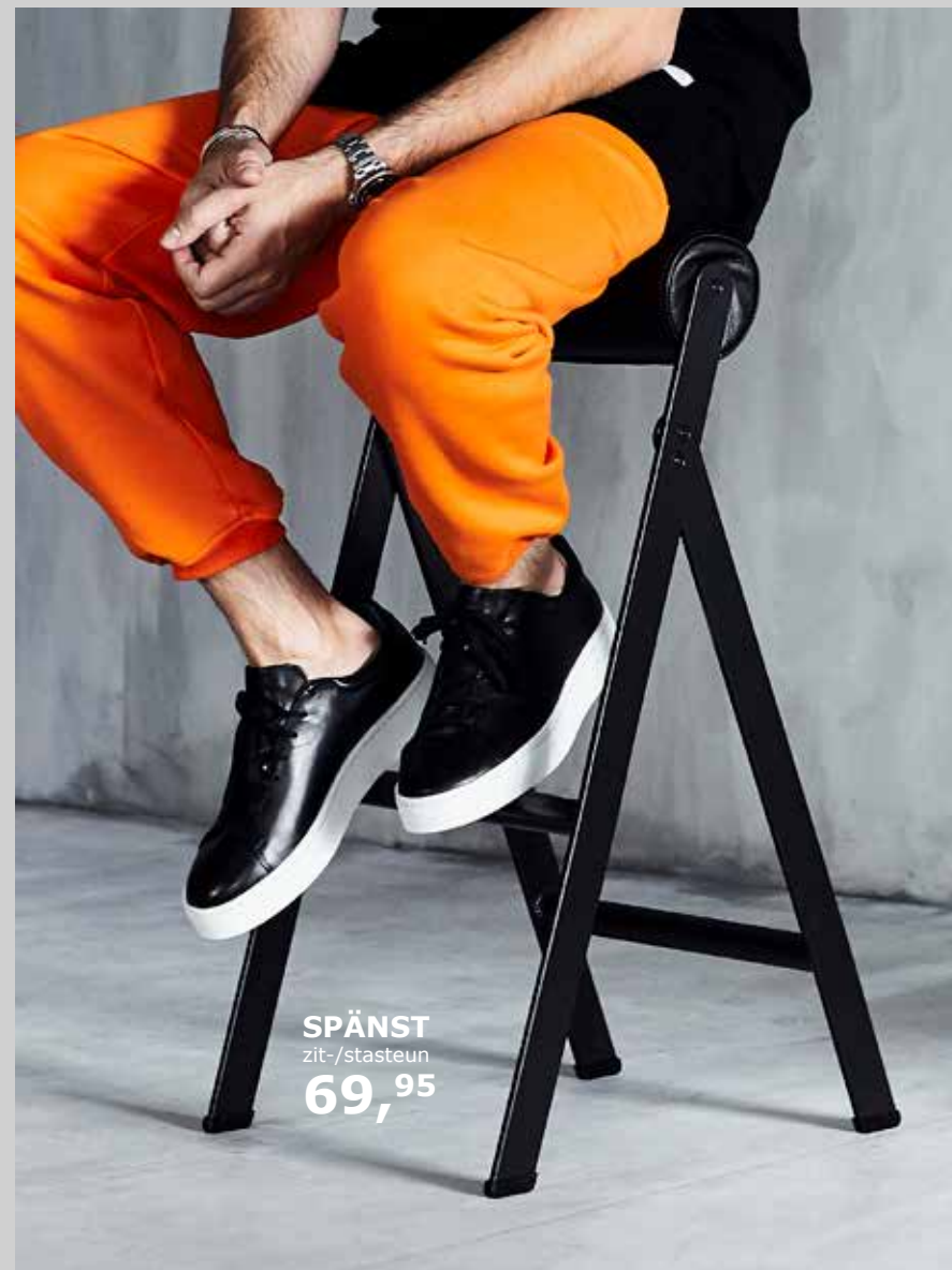
SPÄNST zit-/stasteun 69,95