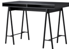
PE663236 SPÄNST tafelblad met schragen 249,- Afgewerkt met verf, blank gelakt massief essen. 136x70 cm. H 110 cm. Zwart. 003.985.85