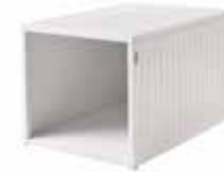
PE663204 SPÄNST schoenendoos 14,99 Gepoederlakt staal. 27x38 cm. H 24 cm. Wit. 004.003.95