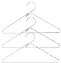
PE663286 SPÄNST hanger 2,99/3 st.. Geanodiseerd aluminium. B 40 cm. 103.926.58