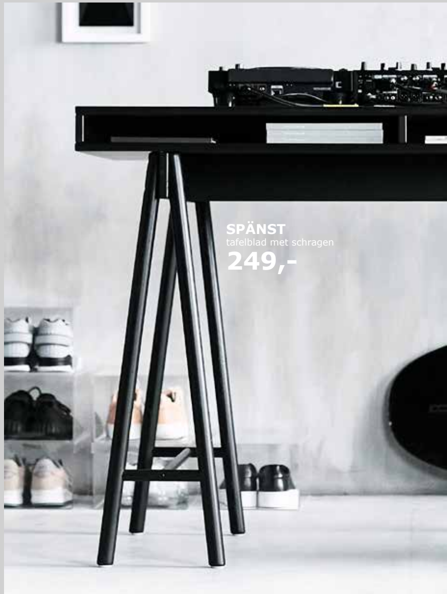
SPÄNST tafelblad met schragen 249,-