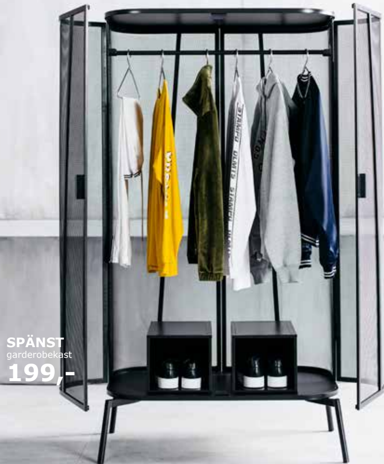
SPÄNST garderobekast 199,-