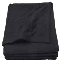
PE672078 SPÄNST plaid 34,99 Je kan de look makkelijk veranderen want beide kanten hebben een ander kleur. 83% katoen, 17% polyester. 120x180 cm. Zwart/grijs. 804.131.48