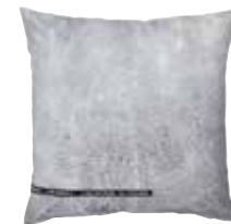
PE663197 SPÄNST kussenovertrek 6,99 Makkelijk af te nemen dankzij de rits. 100% katoen. 50x50 cm. Lichtgrijs. 504.082.85