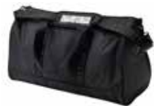
PE663457 SPÄNST duffeltas 39,99 100% nylon. Zwart. 704.015.27