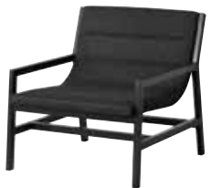
PE672071 SPÄNST fauteuil 229,- Hoes: 100% katoen. Poten: Blank gelakt massief beuken. 78x82,5 cm. H 80,5 cm. Vansta zwart. 804.172.12