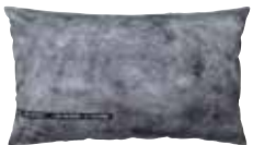
PE663195 SPÄNST kussenovertrek 7,99 Makkelijk af te nemen dankzij de rits. 100% katoen. 65x40 cm. Donkergrijs. 304.104.87