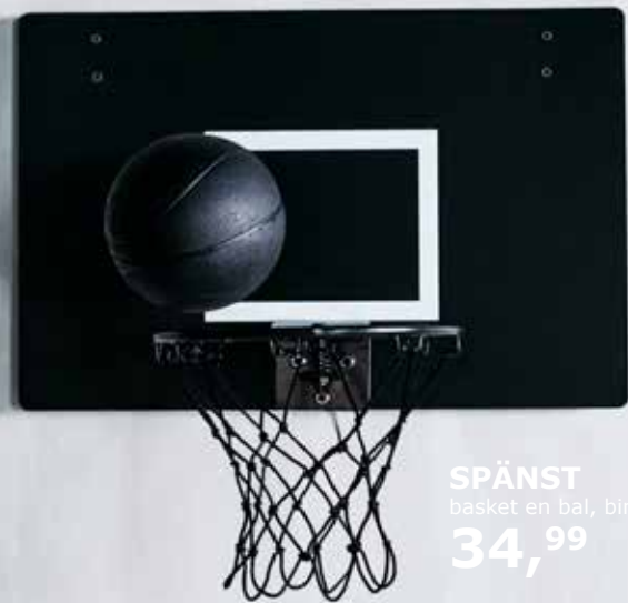
SPÄNST basket en bal, binnen 34,99

PH149823 SPÄNST fauteuil 229,-/st. 804.172.12