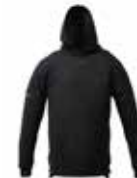
PE672074 SPÄNST hoody, XL 24,99 83% katoen, 17% polyester. Zwart. 304.134.62