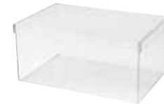
PE663215 SPÄNST schoenendoos 24,99 Acryl. 38x25 cm. H 17 cm. Transparant. 804.012.68