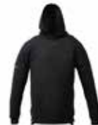
PE672074 SPÄNST hoody, S 24,99 83% katoen, 17% polyester. Zwart. 304.131.60