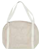
PE663201 SPÄNST waszak 9,99 100% polyester. 47 L. Beige. 004.103.75