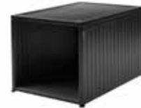
PE663202 SPÄNST schoenendoos 14,99 Gepoederlakt staal. 27x38 cm. H 24 cm. Antraciet. 204.003.99