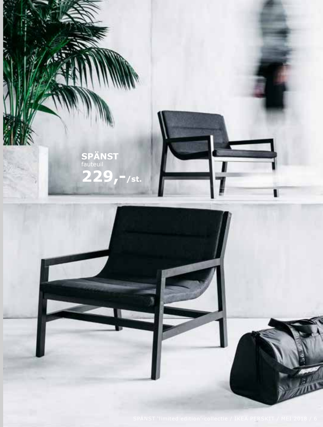
SPÄNST fauteuil 229,-/st.

PH149823 SPÄNST fauteuil 229,-/st. 804.172.12