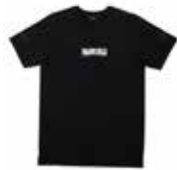
PE663447 SPÄNST T-shirt, L 12,99 100% katoen. Zwart. 404.131.69