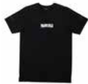
PE663447 SPÄNST T-shirt, XL 12,99 100% katoen. Zwart. 604.132.34