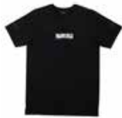
PE663447 SPÄNST T-shirt, M 12,99 100% katoen. Zwart. 704.131.63