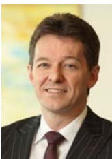
Johan Thijs, Groeps-CEO:

Als we de invloed van de legacy-activiteiten (CDO's, desinvesteringen) en de waardering van het eigen kredietrisico niet in aanmerking nemen, bedroeg de aangepaste nettowinst 387 miljoen euro voor het eerste kwartaal van 2014, tegenover een verlies van 340 miljoen euro in het laatste kwartaal van 2013 en een winst van 359 miljoen euro in het eerste kwartaal van 2013.