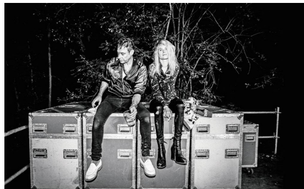
© Koen Keppens: Amenra – David Byrne – The Black Keys