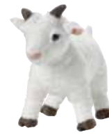
NOUVEAU LAPPGET peluche, chèvre 4,99 Designer: IKEA of Sweden 102.802.17