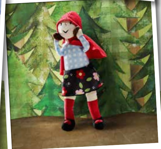
Le monde de LILLGAMMAL