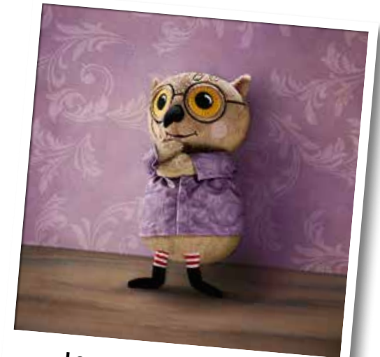
Le monde de KATTUGGLA