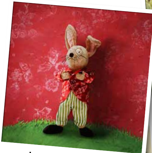
Le monde de PIPHARE

Octobre 2014 marque le lancement d'une toute nouvelle gamme de peluches dans les magasins IKEA. Nous avons choisi 5 héros comme visages de la campagne. Ce ne sont peut-être que des peluches mais elles travailleront dur pour faire de la campagne de cette année la plus fructueuse de toutes.