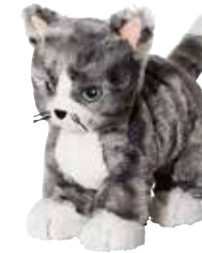
LILLEPLUTT peluche, chat 5,99 Designer: IKEA of Sweden 002.604.51