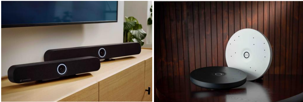
Oplossingen uit de Sennheiser TeamConnect-familie