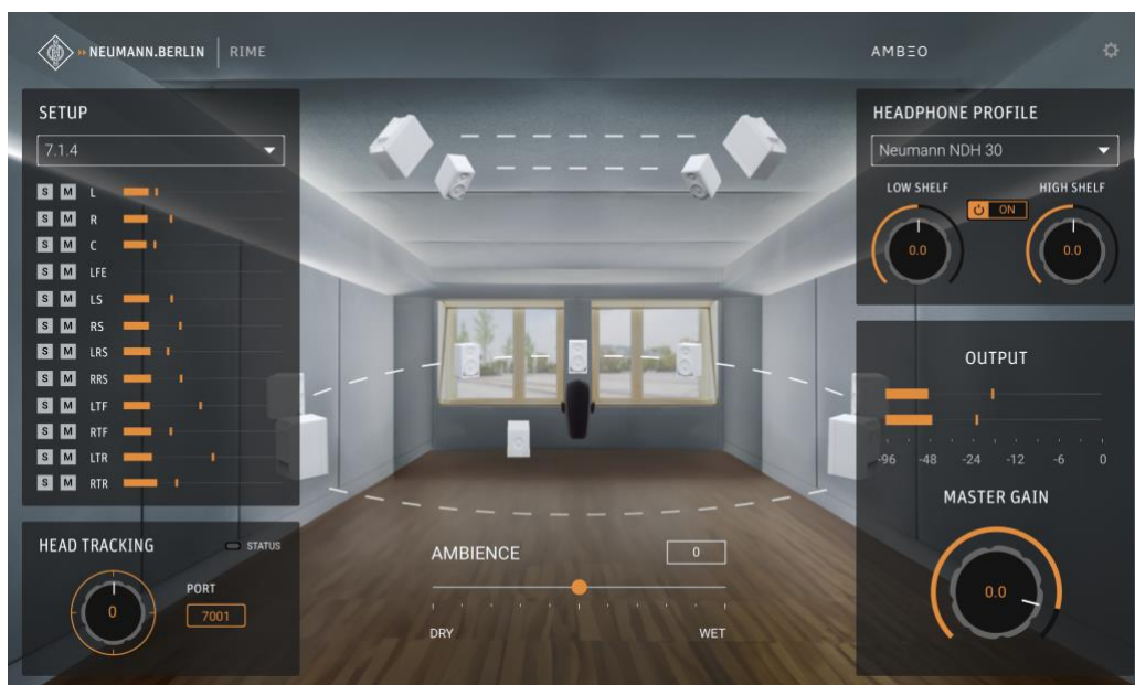
Neumanns nieuwe DAW plug-in RIME (Reference Immersive Monitoring Environment)

Neumann zal zijn innovatieve referentiemonitoring-oplossingen in de Immersive Zone van de Sennheiser Group-stand tonen. De opstelling omvat Neumanns vermaarde KH-reeks met studiomonitors, maar ook de MT 48 audio-interface waarop de Monitor Mission draait. Daarnaast geeft Neumann een preview van een gloednieuw product: RIME - Reference Immersive Monitoring Environment . RIME is een plug-in voor DAW's, waarmee gebruikers immersieve formaten als Dolby Atmos 7.1.4 kunnen monitoren via hoofdtelefoons met behulp van nieuwe AMBEO-algoritmes. In tegenstelling tot bestaande oplossingen is RIME specifiek gemaakt voor Neumann NDH 20- en NDH 30-hoofdtelefoons. De software omvat immers een volledige Neumann-signaalketen KH-luidsprekers, perfect gealigneerd via MA 1 in een referentieruimte, opgenomen met behulp van de KU 100 binaurale kop via de MT 48. Het resultaat is een ultieme geluidskwaliteit en nauwkeurigheid. RIME kan ook worden gebruikt om stereoweergave te externaliseren, zodat hoofdtelefoons klinken als studiomonitors.