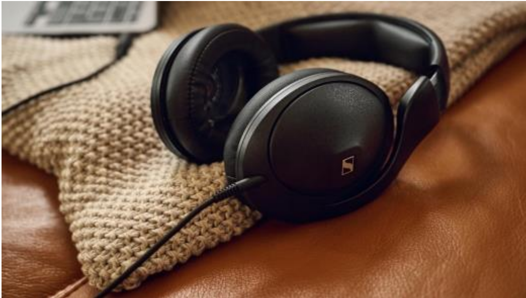
Foto: de HD 620S is gemaakt van premium materialen voor een lange levensduur en comfort