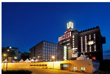
Le Dortmunder U

# Ville médiévale, le patrimoine architectural de Dortmund compte deux églises médiévales majeures : la Reinoldikirche et la Marienkirche.