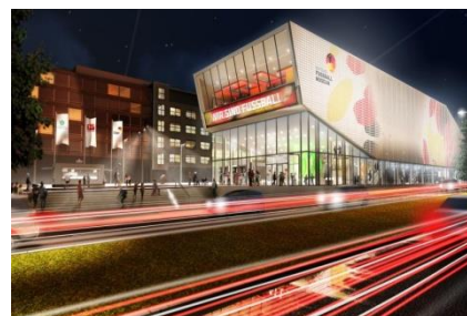
Le Football Museum

# La Tour U, un centre d'art contemporain, nouveau haut lieu de la culture numérique, réputé pour les installations vidéos projetées sur sa façade.