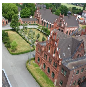
Le Musée de l'Industrie