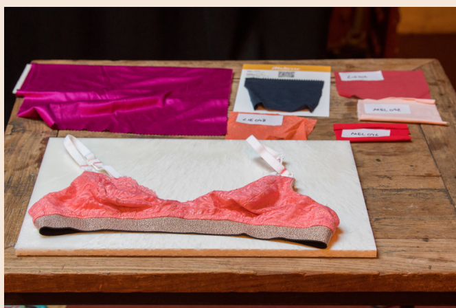
Le premier prototype