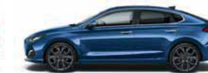
Stargazing Blue (SG5)