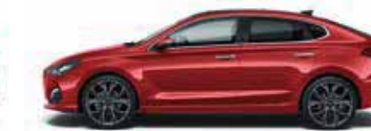
Fiery Red (PR2)