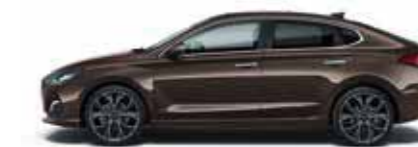
Moon Rock (XN3)