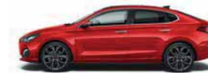
Engine Red (JHR)