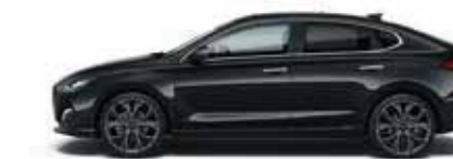
Phantom Black (PAE)

* Uniquement disponible sur Feel et Shine