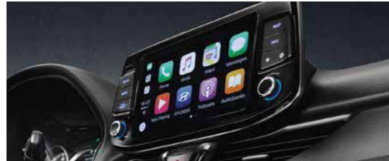
L'écran tactile 8" regroupe la navigation 3D, les médias et les fonctions de connectivité. Il inclut un abonnement gratuit de 7 ans aux services LIVE, avec des informations sur la circulation en temps réel, la météo et les points d'intérêt.

La i30 est la première Hyundai équipée du Driver Attention Warning (DAW). Ce système détecte instantanément lorsque l'attention du conducteur se relâche et qu'il adopte une conduite moins sécurisée. Autres technologies de sécurité avancées : le Forward Collision Warning (FCW) et l'Advanced Smart Cruise Control (ASCC).