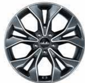
Jante en alliage 18"