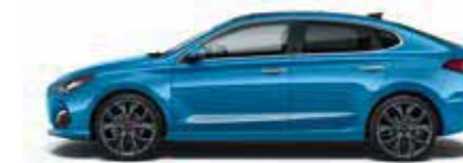
Ara Blue (R3U)