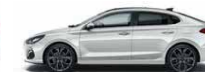
Platinum Silver (U3S)