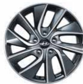
Jante en alliage 17"