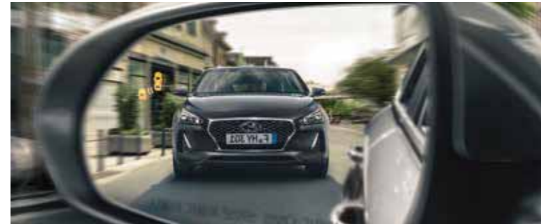
Blind Spot Collision Warning. À l'aide de deux détecteurs radar dans la partie inférieure du pare-chocs arrière, le système vous avertit de la présence de véhicules dans les angles morts. Si vous activez votre clignotant à ce moment-là, une alerte sonore retentit.