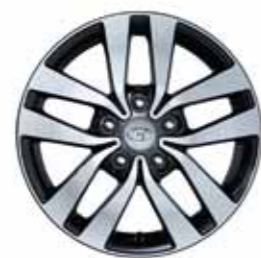
Jante en alliage 16"