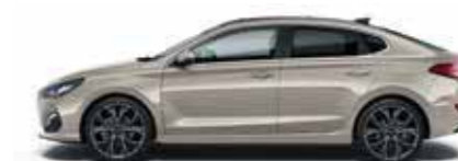
White Sand (Y3Y)