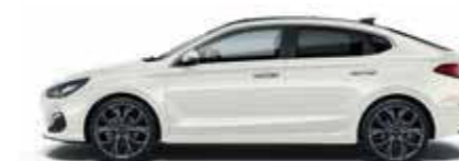
Polar White (PYW)