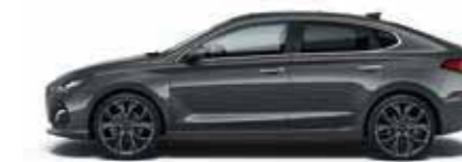
Pepper Grey (Z3G)