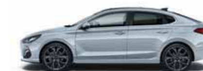
Clean Slate (UB2)