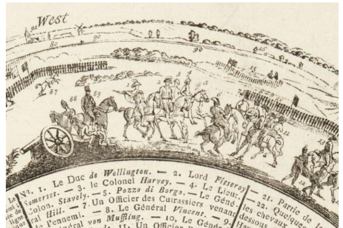
Detail uit het panorama van Louis Dumoulin, 1912