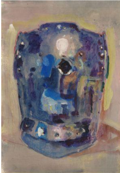
Koen Broucke, Draagsporen, 2015

Het kuras uit 'A dialogue at Waterloo' komt ook terug in tekeningen die Broucke maakte van de