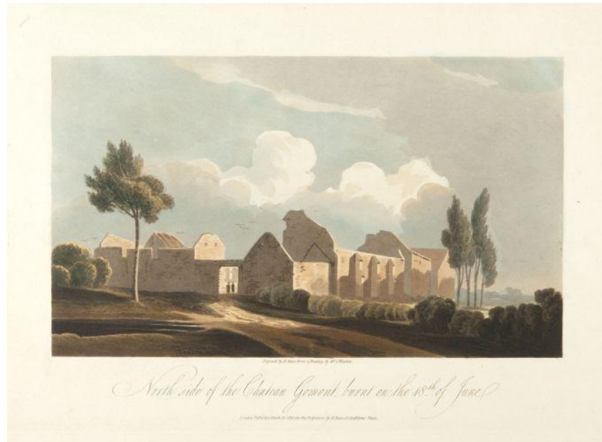
R. Reeve, 'North side of the Chateau Gomont, burnt on the 18th of June', 1816

Er is een interessante tegenstelling tussen de naïeve prentenmakers, die snel moesten voldoen aan de enorme vraag van de overwegend Britse toeristen die vanaf de eerste dag na afloop van de veldslag ter plaatse opdoken, en de meer geësthetiseerde prenten die de nadruk leggen op het sublieme landschap en de verstilde ruïne. De eerste soort is spectaculair omdat we hier als het ware zelf ooggetuigen worden van het met lijken bezaaide slagveld. De tweede soort verwijst duidelijk naar de romantische landschapsuitbeelding van bijvoorbeeld Caspar David Friedrich. Dat geldt onder meer voor de prachtige, met de hand ingekleurde reeks engraved by R. Reeve, from a Drawing by Mr S. Wharton .